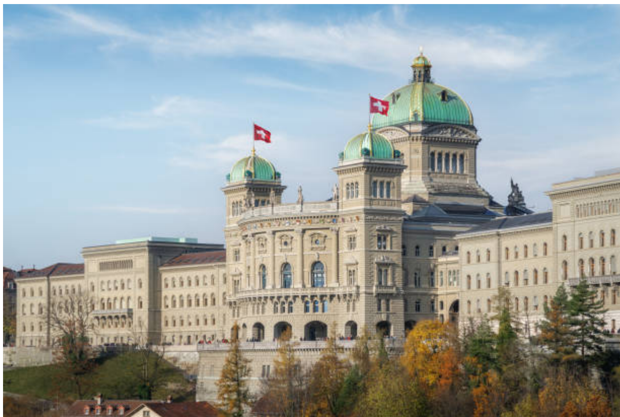
Федеральная дворец в Берне

Auteur: Надежда Сикорская, Берн , 06.10.2025.