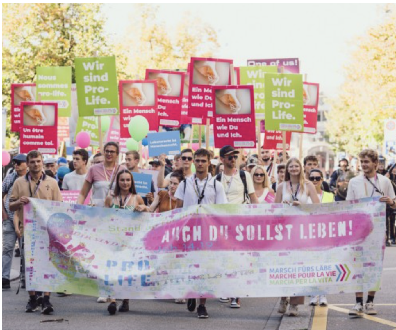
Участники «Марша за жизнь».

Auteur: Заррина Салимова, Цюрих , 23.09.2025.