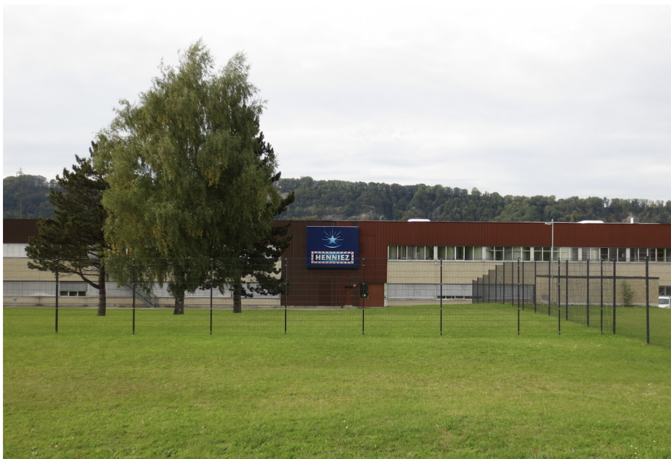
Завод Henniez в Энье.

Auteur: Заррина Салимова, Лозанна , 03.07.2025.