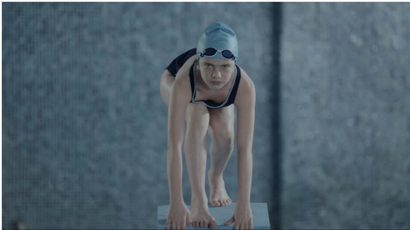
Кадр из фильма «Inhale».

Высшей школе искусства и дизайна (HEAD) в Женеве. Главная героиня ленты, тринадцатилетняя Нино, незадолго до важных соревнований по плаванию обнаруживает, что у нее впервые началась менструация. Тренер не разрешает ей участвовать в соревнованиях, утверждая, что ее женское телосложение не подходит для спорта. Нино чувствует себя преданной как своим тренером, так и своим телом. Фильм можно будет посмотреть 25 и 27 января.