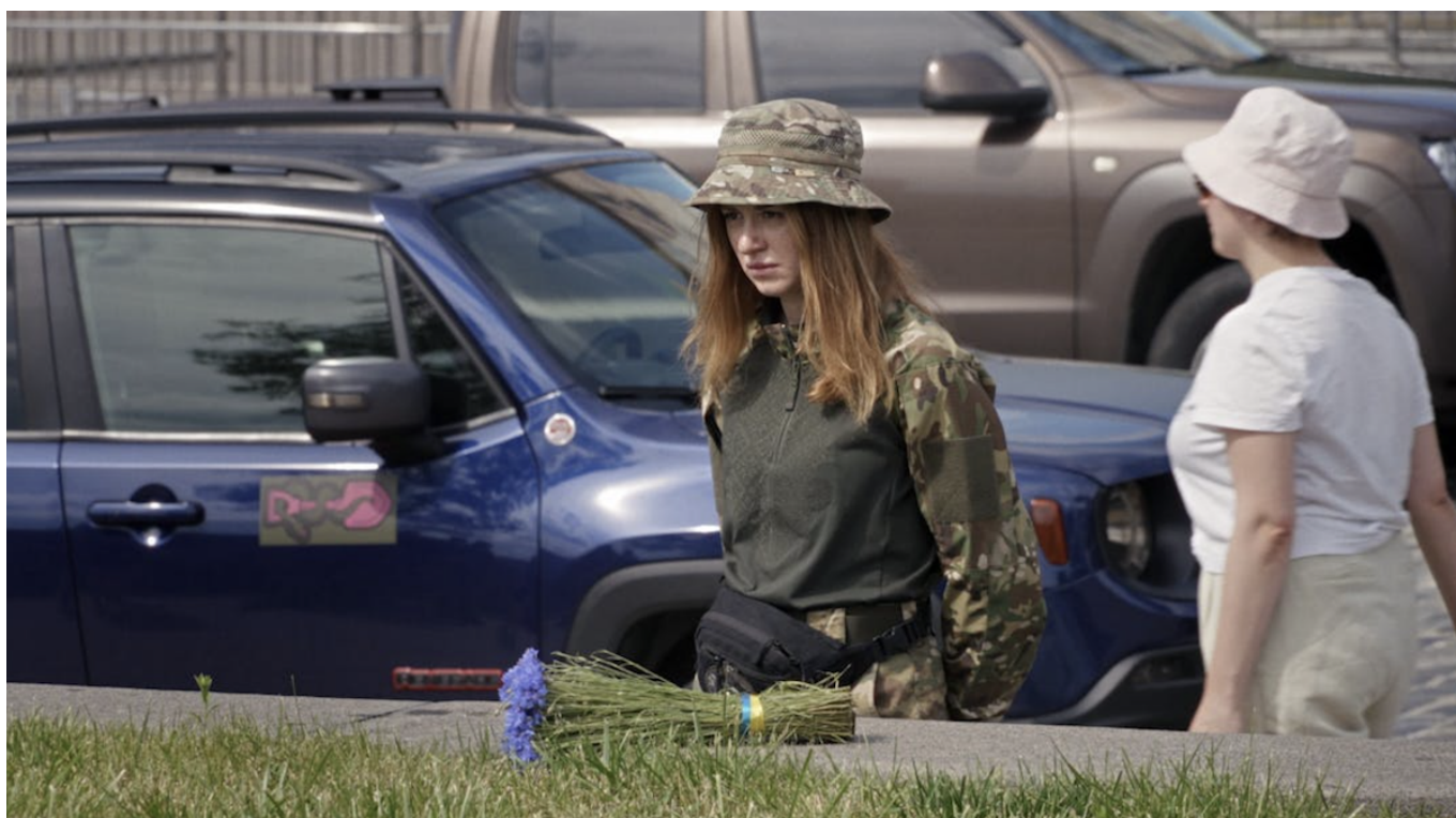
Кадр из фильма «Берегиня – женщины Киева».

В программу включена и документальная лента Вито Роббиани «Берегиня – женщины Киева» , которую можно будет посмотреть 25 января. Фильм позволит погрузиться в будни четырех женщин-редакторов украинской версии журнала «Elle», которые продолжают выпускать модный журнал, несмотря на войну. Их повседневная жизнь становится символом сопротивления, а их ответ на жестокость – это красота, культура и решимость.