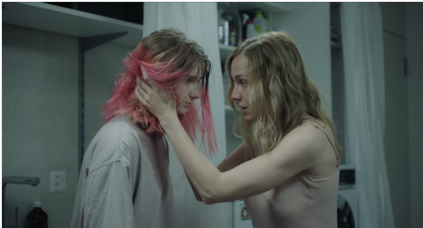
Кадр из фильма «За стеклом».

В программу включена и документальная лента Вито Роббиани «Берегиня – женщины Киева» , которую можно будет посмотреть 25 января. Фильм позволит погрузиться в будни четырех женщин-редакторов украинской версии журнала «Elle», которые продолжают выпускать модный журнал, несмотря на войну. Их повседневная жизнь становится символом сопротивления, а их ответ на жестокость – это красота, культура и решимость.