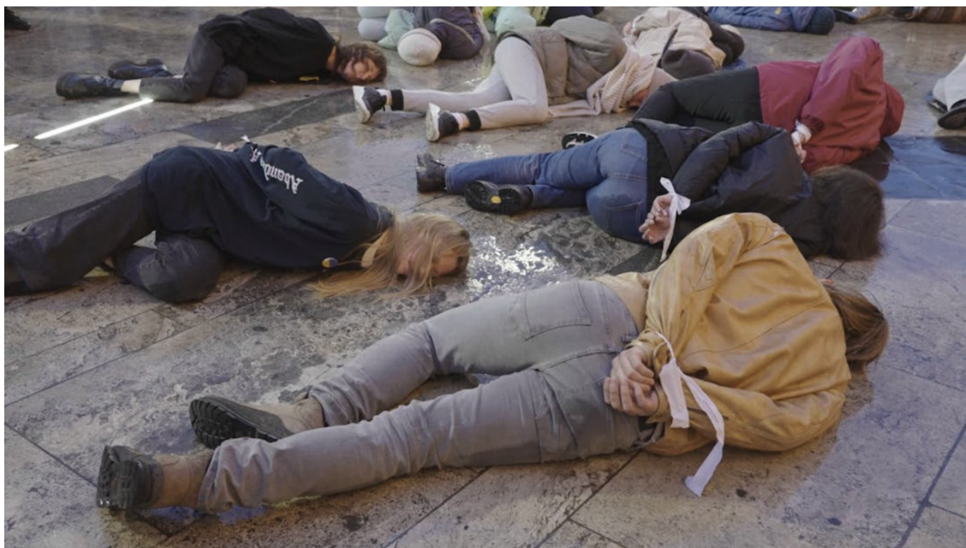
Кадр из фильма «Дом».

За главный приз Золотурнского фестиваля – и самую престижную кинопремию Швейцарии – поборются два художественных и четыре документальных фильма, включая «Дом» Светланы Родиной и Лорана Ступа. Картина посвящена потерявшему поколение молодых россиян. В приюте для беженцев в Тбилиси оказываются активистка движения за права женщин, молодая пара журналистов, сторонник Алексея Навального, политический блогер. Все они были вынуждены покинуть родину из-за войны и репрессий: в Грузии они живут как цифровые диссиденты и отсюда отправляются на поиски нового дома. Ленту можно будет посмотреть 25 и 28 января.