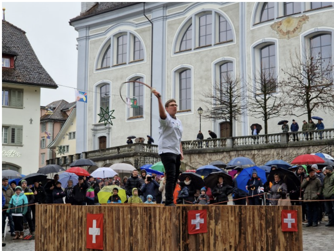
Так проходило соревнование в Швице в прошлом году.

В Тичино в этот день проходит традиционная акция Nodada de la Befana – историческое январское купание в холодных водах озера Маджоре. Любители адреналина и моржевания должны преодолеть дистанцию длиной 80 метров, причем плыть нужно строго в плавках или купальниках – гидрокостюмы запрещены. Понаблюдать за отважными пловцами у пристани «La Resiga» в Бриссаго ежегодно приходят сотни человек. Эпифания в Тичино – это еще и аналог дня Святого Николая в других частях страны. 6 января ведьмы по имени Бефана «летают» от дома к дому на своих метлах, чтобы раздать послушным детишкам орехи, мандарины и сладости. Непослушным же ребятам они дарят куски угля.