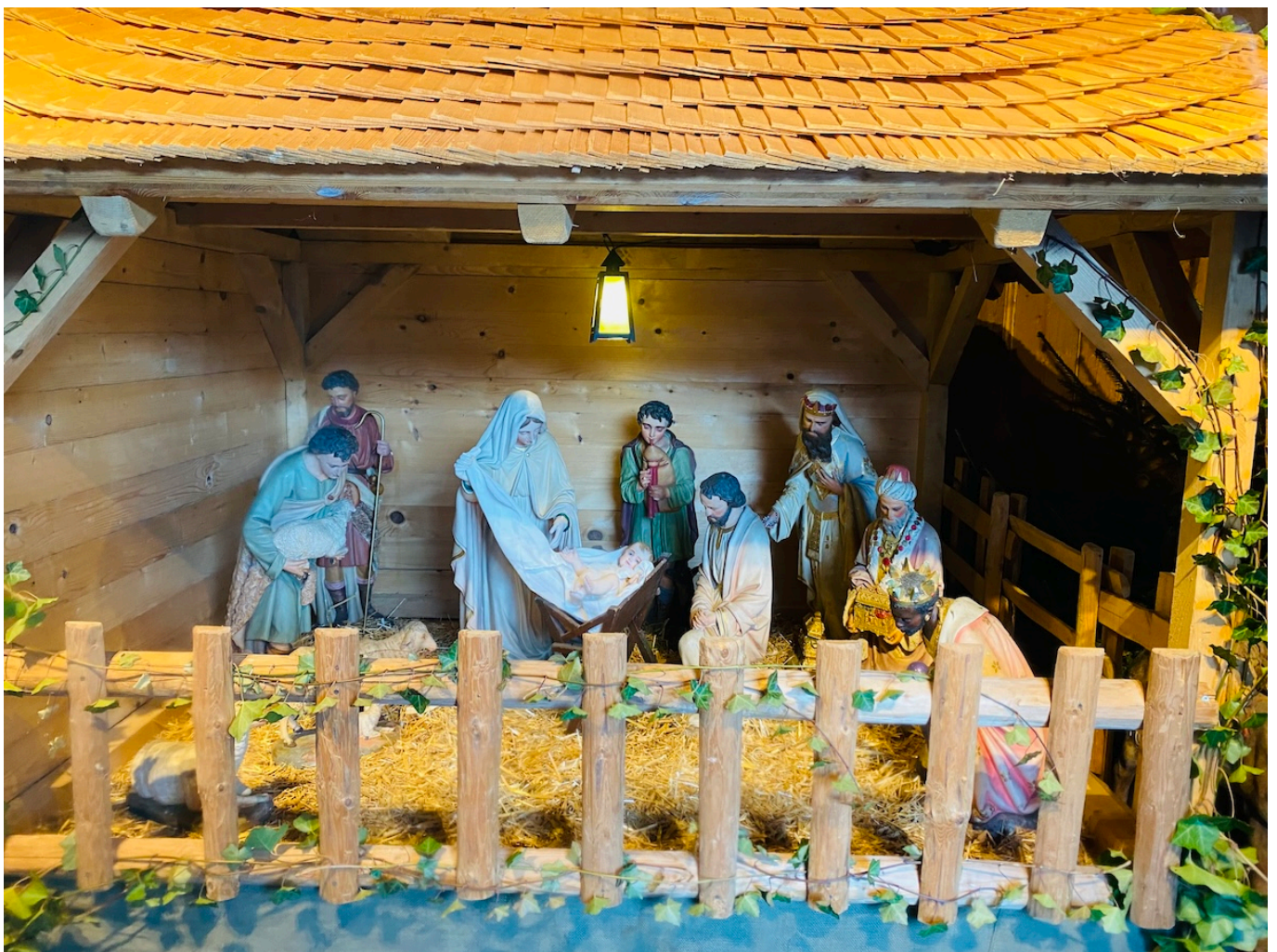
Рождественский вертеп в церкви Грюейра.

Auteur: Заррина Салимова, Берн , 03.01.2025.