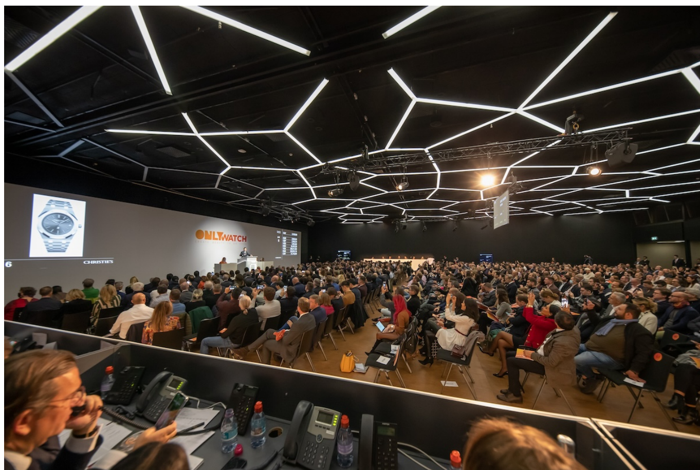
Фото: Only Watch

Auteur: Заррина Салимова, Женева , 12.11.2024.