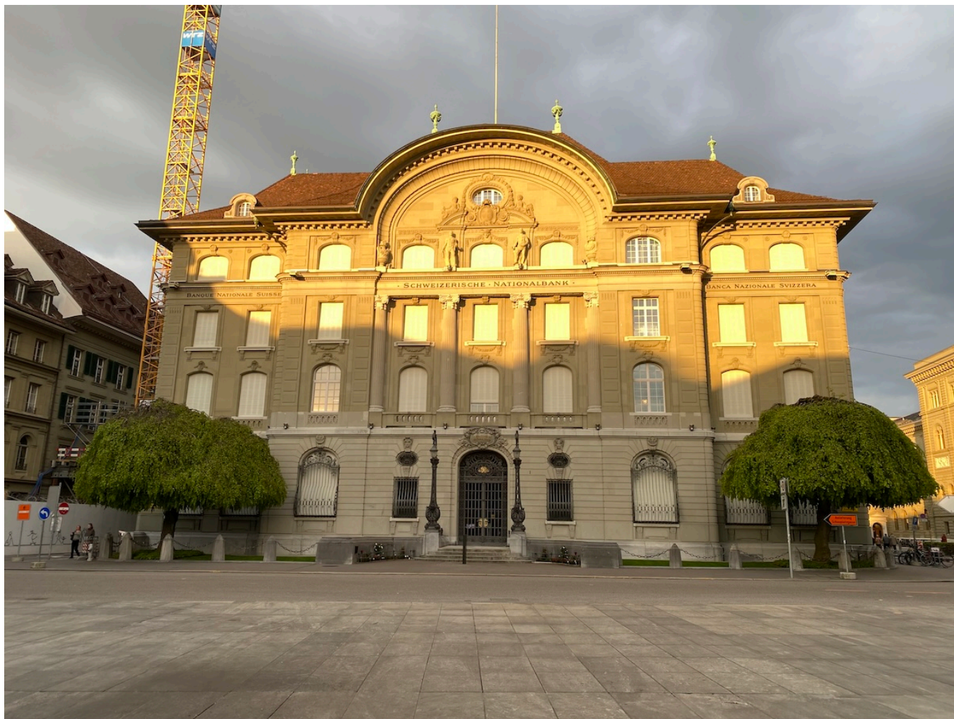
Здание Нацбанка в Берне.

Auteur: Заррина Салимова, Берн , 27.09.2024.