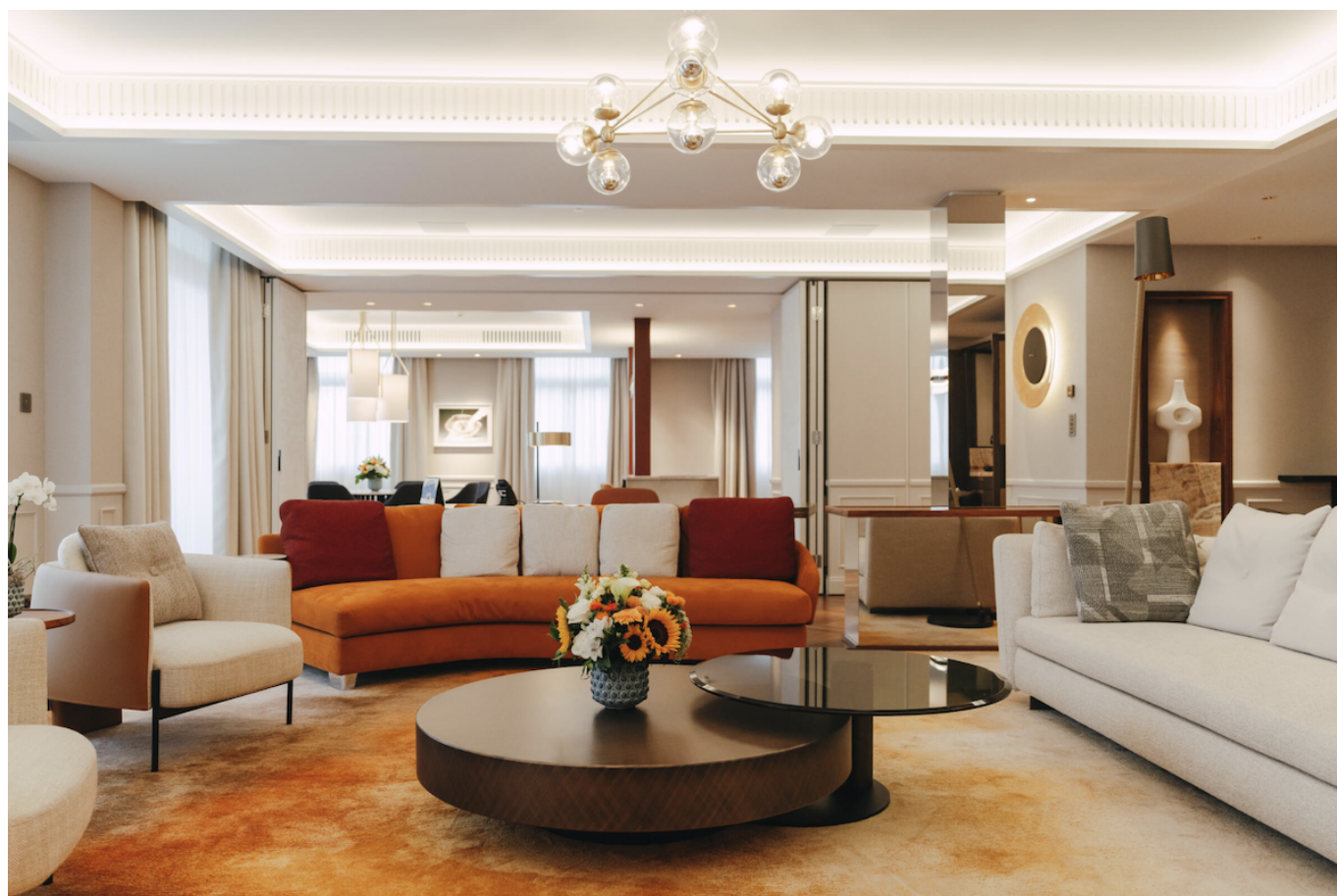
Президентский люкс.