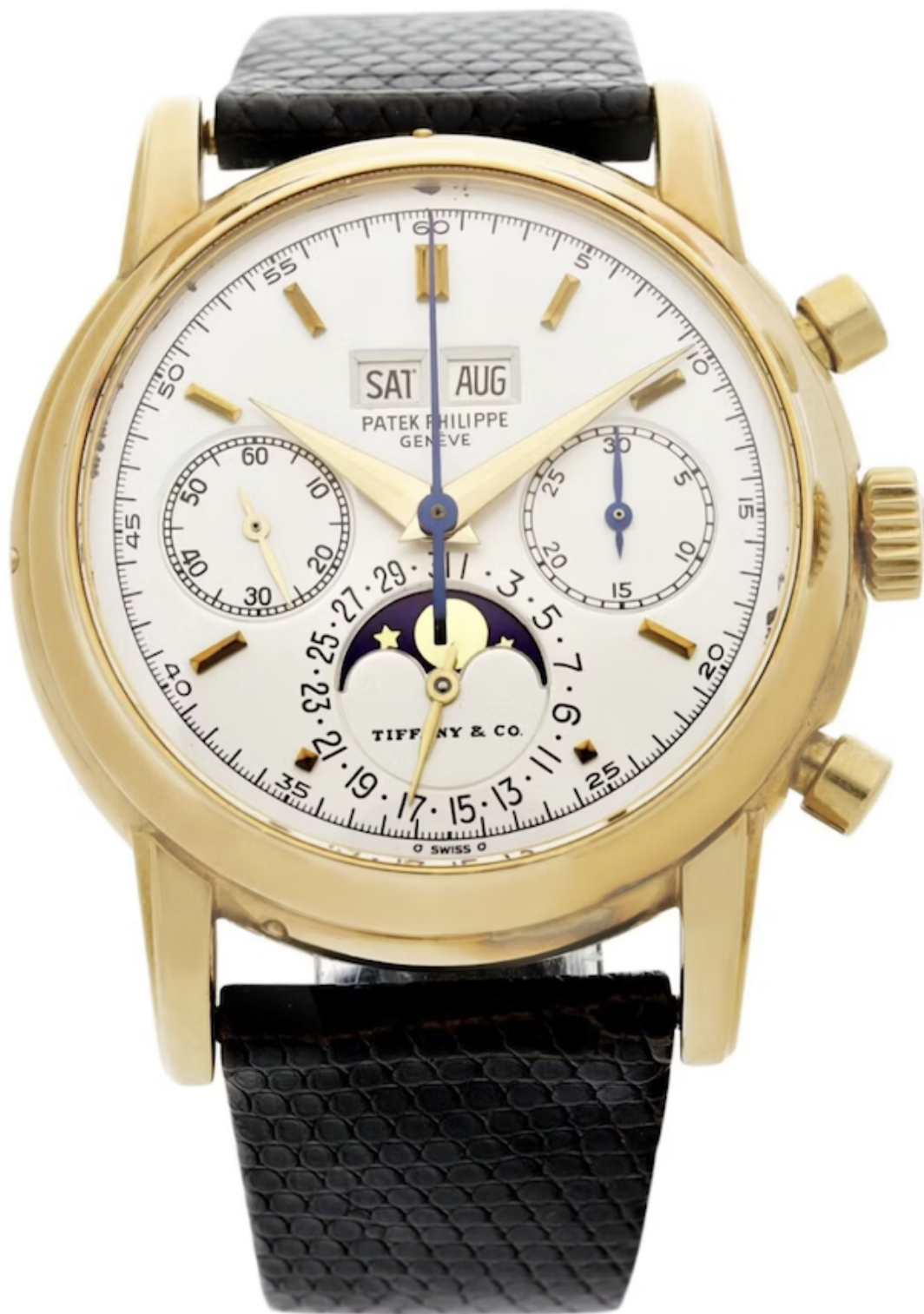
Patek Philippe 2499 – такая же модель, как у Джона Леннона.