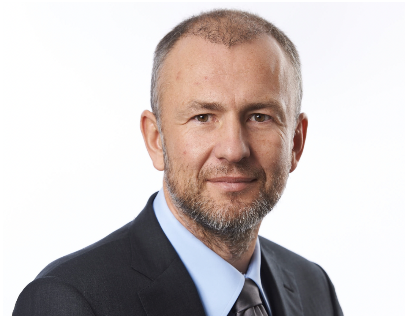
Андрей Мельниченко в 2017 году.

основанная им группа СУЭК, являющаяся одним из крупнейших в мире производителей угля, незаконно приобрела сибирскую компанию «СИБЭКО», хотя состоявшаяся в 2018 году сделка была одобрена властями. Прокуратура РФ хочет, чтобы государство вернуло себе «СИБЭКО». В деле фигурирует лично Андрей Мельниченко. «Эти проблемы могут быть вызваны его позицией по войне в Украине, которая отличается от официальной версии», - пишет Bilan.