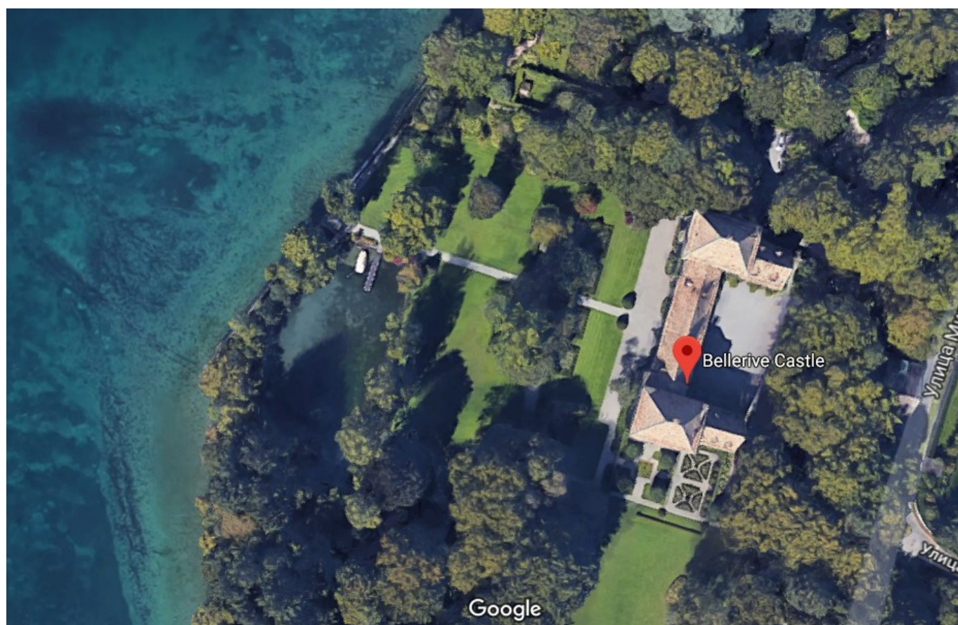
Вид со спутника на замок Бельрив.

Занимающая 23-место в списке богатейших людей Швейцарии Динара Кулибаева владеет состоянием, оцениваемым в 2-3 млрд франков. Дочь Нурсултана Назарбаева после более двух лет ожидания получила окончательное разрешение на проведение ремонтных работ в замке Белльрив . Если все пойдет по плану, она сможет переехать туда в течение двух лет.