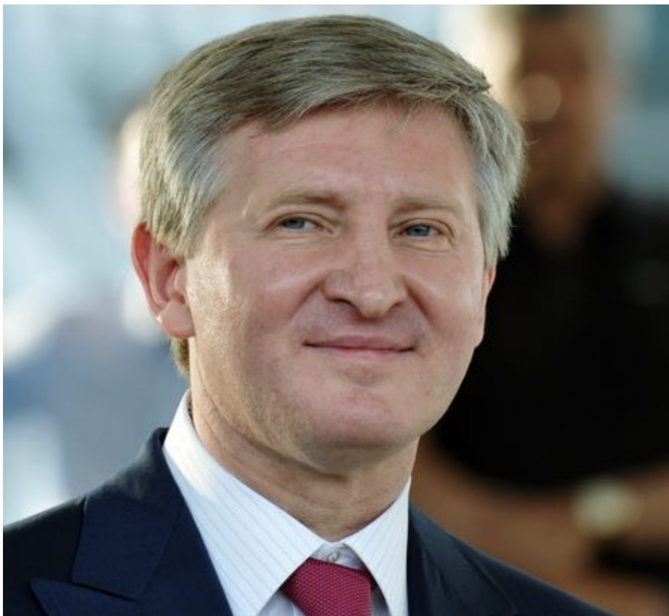
Ринат Ахметов в 2013 году.