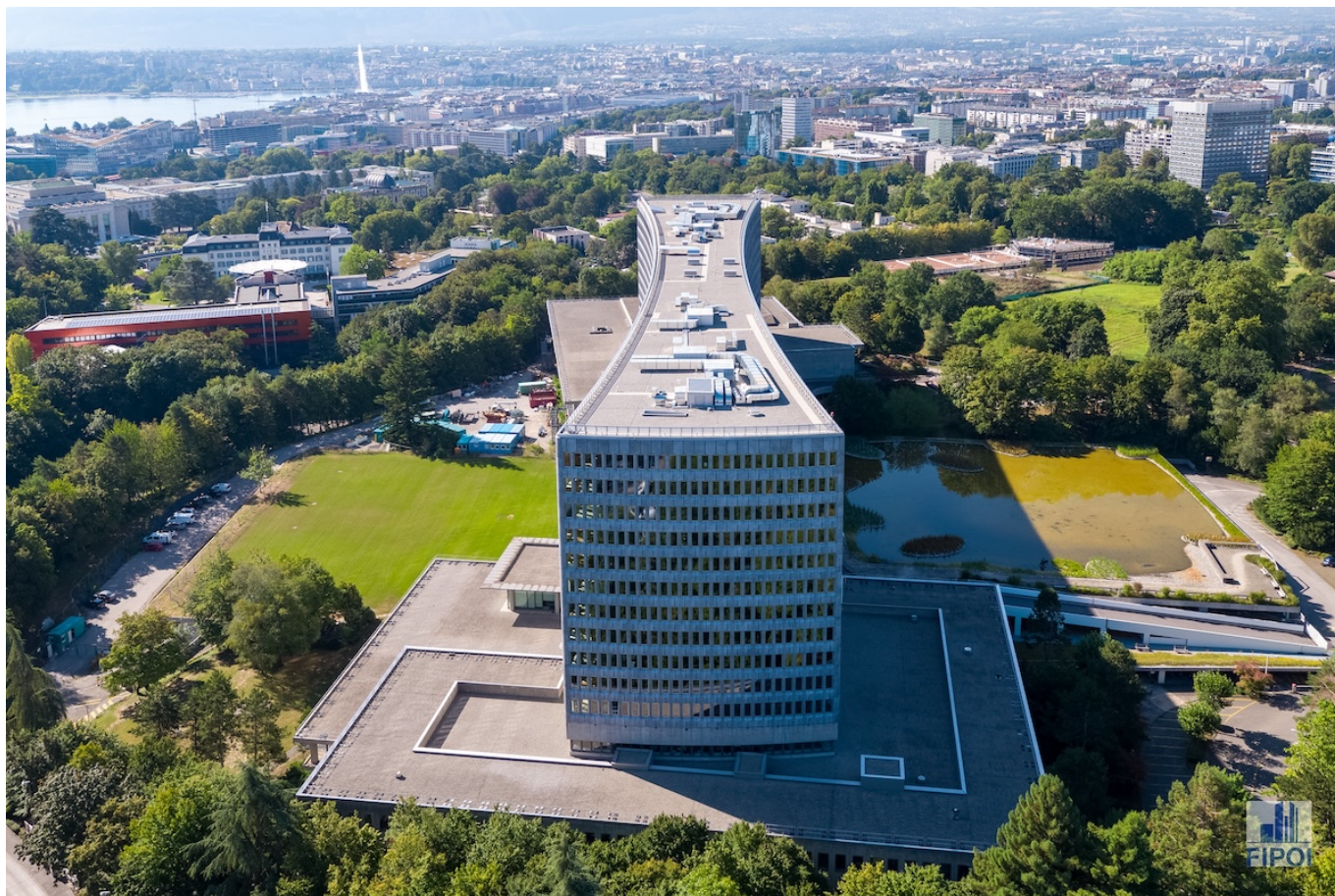
Здание штаб-квартиры МОТ в Женеве.

Auteur: Заррина Салимова, Женева , 13.11.2023.