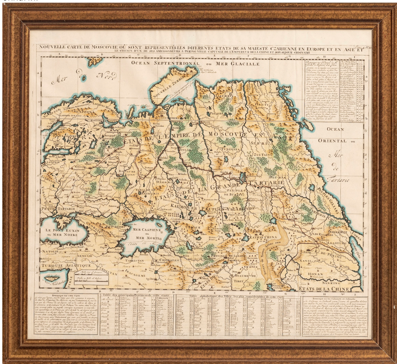
Новая карта Московии. Амстердам, 1718-1720 гг.

хранящейся в Историческом музее Лозанны и изображающей рабочий кабинет Лагарпа на улице Мартерей, аналогичный портрет Александра I висит между двумя окнами.