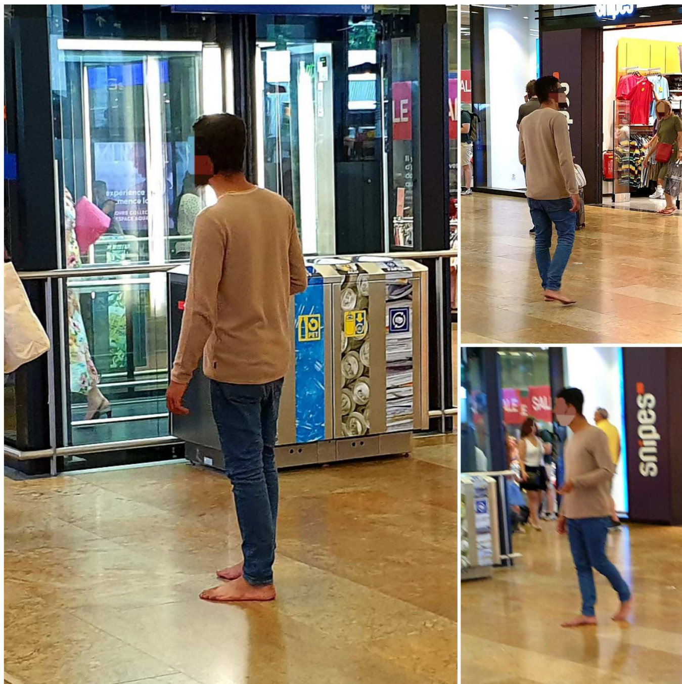
Попрошайка на вокзале.

Разумеется, это всего лишь мое впечатление, я не имею ни малейшего представления об обстоятельствах этих людей. Потом, когда на остановке трамвая один из этих «клиентов» подошёл ко мне и стал клянчить франк, мне подумалось, что здесь есть какая-то ловушка. Вряд этот человек всегда мечтал оказаться в такой ситуации, и сомнительно, что такая жизнь – предел его мечтаний.