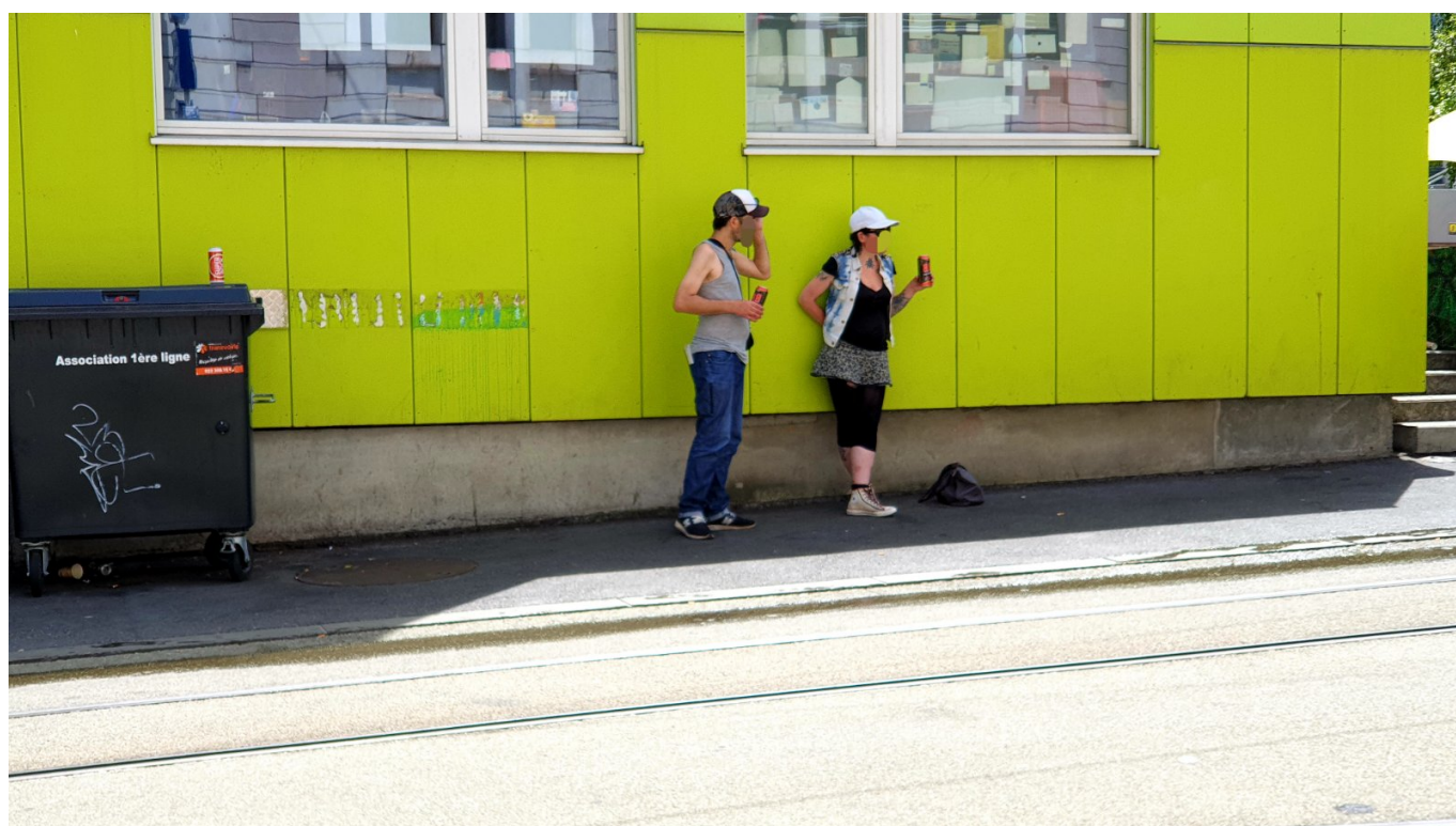
Будний день. Маргиналы чилят.