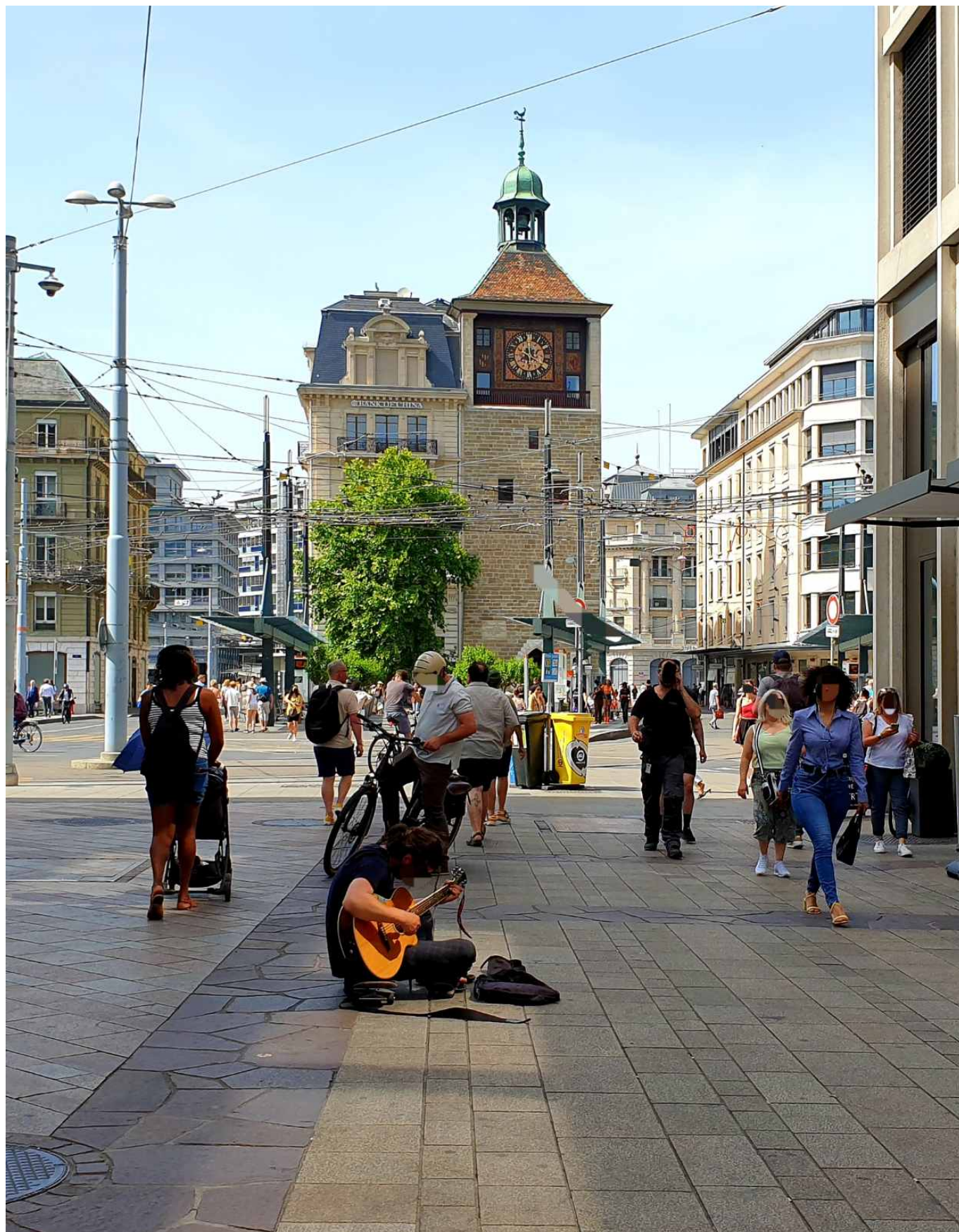
Уличная филармония.

Позже, когда я в неуклюжем отчаянии искал на складе брюки на рост 191 см (не нашёл), пришлось наблюдать, как некоторые клиенты заведения с видом посетителей дорогого бутика придирчиво перебирали вещи, набивали себе по списку сумку и уходили, всеми своими поджатыми губами транслируя мысль: «Ах! Совсем