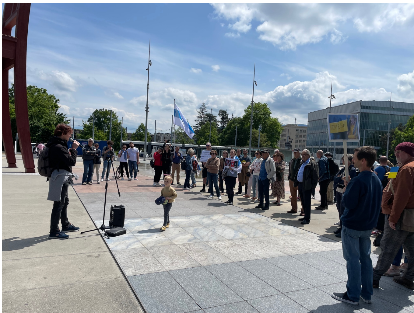
Вчера на площади Наций в Женеве

Auteur: Надежда Сикорская, Женева , 09.05.2022.