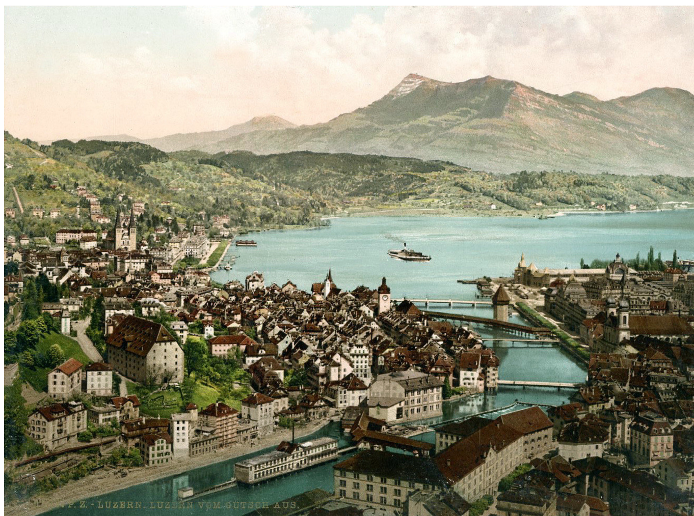
Вид на гору Риги из Люцерна. Фотография начала 20 в.

Повезло насладиться необыкновенным зрелищем и другому русскому путешественнику – выдающемуся государственному и военному деятелю генерал-фельдмаршалу Дмитрию Алексеевичу Милютину. По Швейцарии он путешествовал в молодости, поэтому подъем на гору его не испугал. В своих воспоминаниях он сообщает, что отлично подготовился к восхождению и отправился на вершину в наряде «альпийских пешеходов», то есть «облачился в «холщевое платье, соломенную шляпу, толстые с подковами башмаки и взял в руки длинную альпийскую палку». Ему повезло и он смог наблюдать не только восход, но и закат солнца: «Вид с горы был действительно грандиозен...<> Все глаза были прикованы к западу по направлению спускавшегося величественно за видимый горизонт дневного светила. С закатом солнца нас обдало вдруг холодом; со дна долин поднимались клубы тумана. Все туристы спешили укрыться в тесный домик, стоявший близ вершины горы – единственный приют для путешественников. Кое-как переночевав здесь в тесноте, мы все еще до света были уже на ногах, чтобы видеть восхождение солнца. В этот момент видоизменения в освещении гор едва ли не эффектнее, чем при закате. И тут нам посчастливилось видеть эту картину во всей красоте».