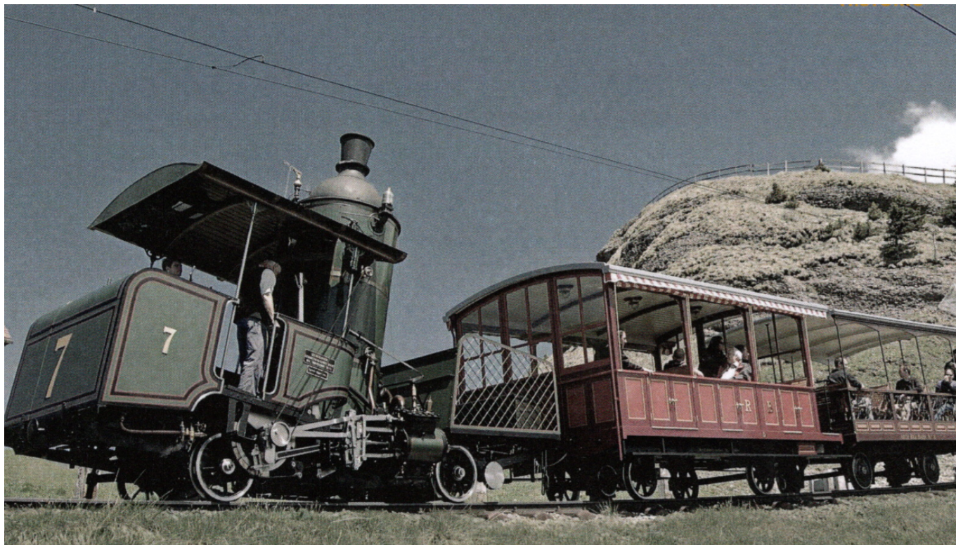
Вот такой паровоз увидел Марк Твен, поднимаясь на вершину Риги

Накануне открытия зубчатой железной дороги на Риги поднялось – пешком или верхом – около 40 тысяч человек! После окончания строительства количество тех, кто смог подняться на вершину, значительно увеличилось. Уже в первый же год эксплуатации дорогой воспользовались 65 тысяч человек, а в 1874 году полюбоваться фантастической панорамой смогли уже более 100 тысяч путешественников! Успех был таков, что в 1875 году построили еще одну зубчатую железную дорогу – из города Гольдау.