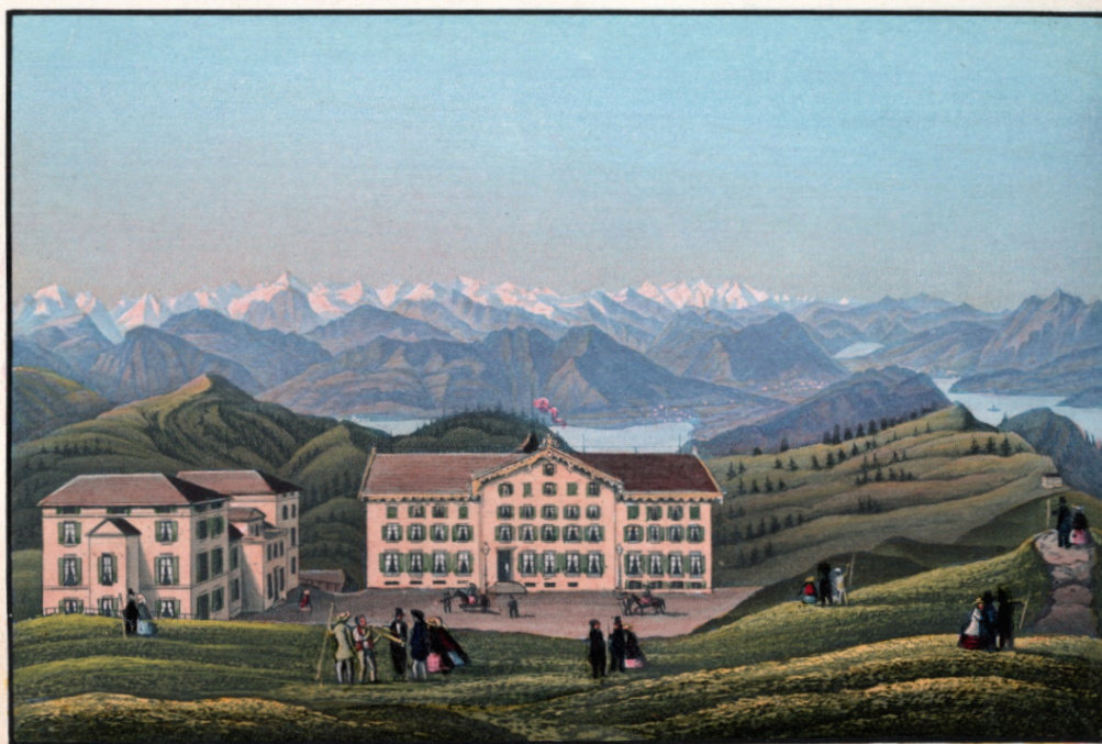
Hotels Rigi Kulm.

Во время мучительного восхождения на Риги Марк Твен увидел поезд, который поднимался по той самой зубчатой железной дороге. Это его поразило: «Около полудня мы двинулись далее и скорым, бодрым шагом устремились к вершине. Пройдя почти 200 метров, мы остановились отдохнуть; закуривая трубку, я скосил глаза немножко влево и увидел в некотором расстоянии от нас целый столб дыма, который, подобно черному червяку, лениво вползал на гору. Это мог быть только дым от какого-нибудь паровоза.