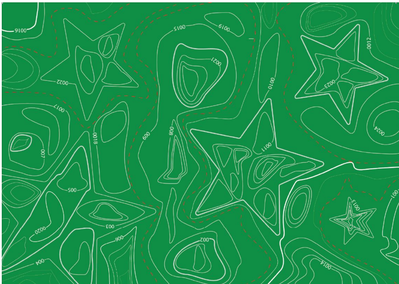
Елочно-зеленые изгибы Виолы Амхерд

И, наконец, Ги Пармелен, президент-элект, как сказали бы в США, представил почти кубическую композицию из треугольников, глаз, людей и животных, графически изобразив таким образом, по его словам, мирное сосуществование всех.