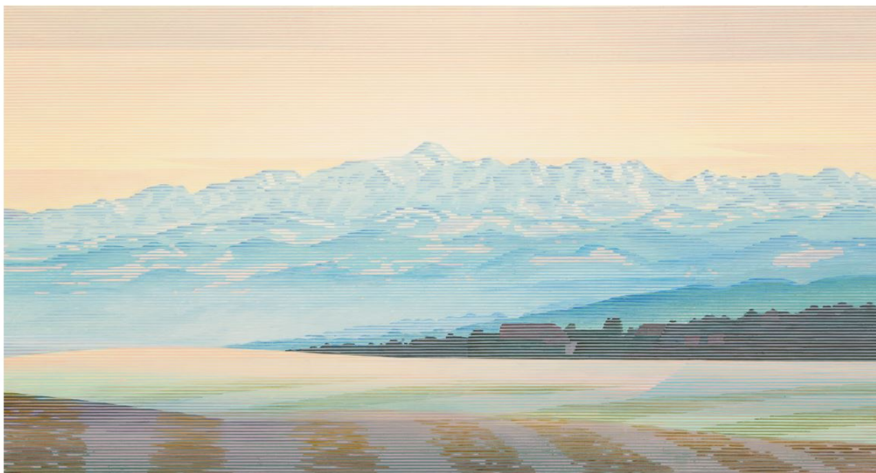
Santis VII, Acryl, 150 x 80 cm, 2018 Arthur Wyss, www.arthurwyss.ch