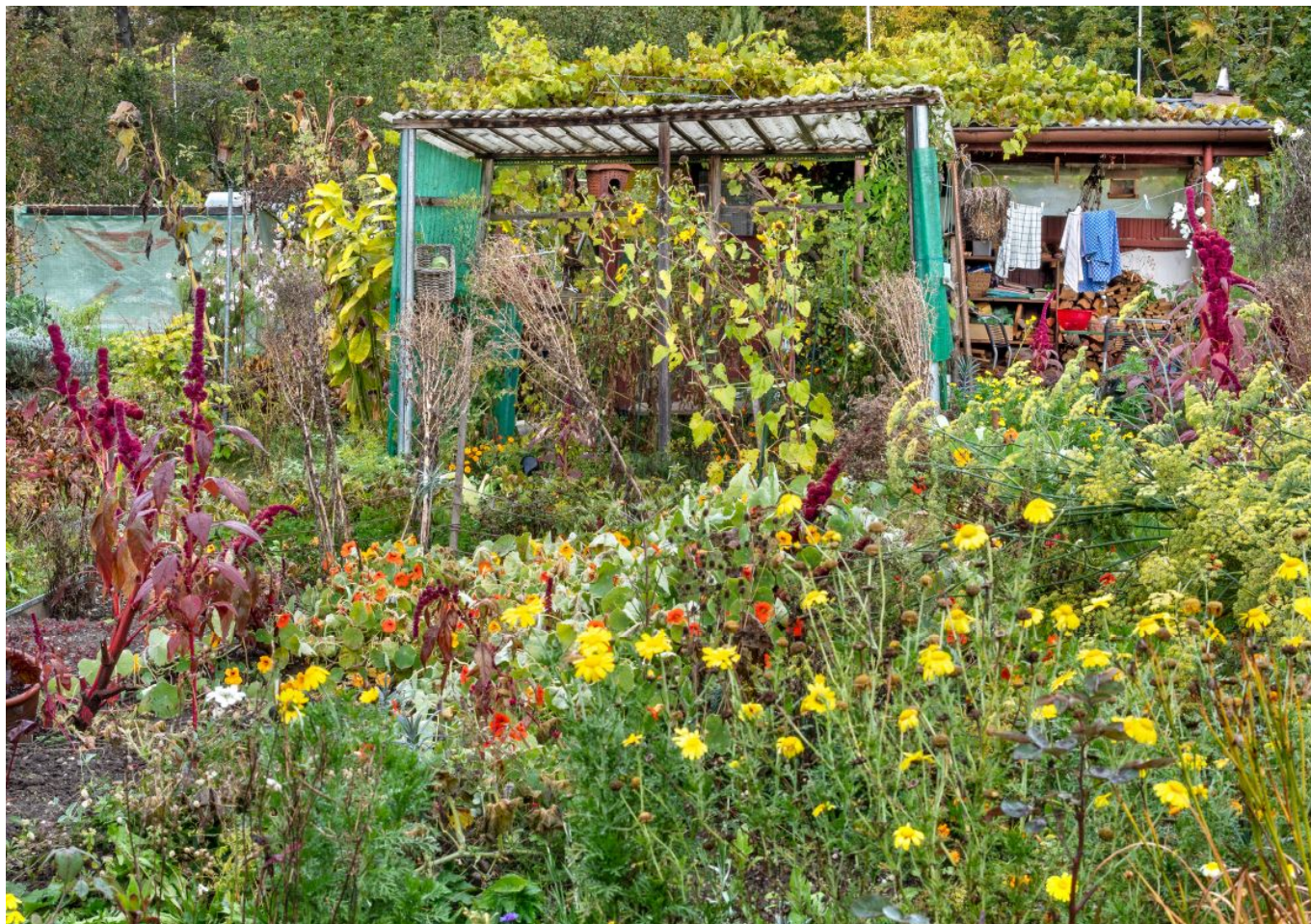
В саду у президентши

Министр финансов Ули Маурэр решил, видимо, подняться над суетой и предложил вид с вершины Стокхорн, в Бернских Преальпах. Снег и солнце – беспроигрышный выбор для истинного швейцарца!