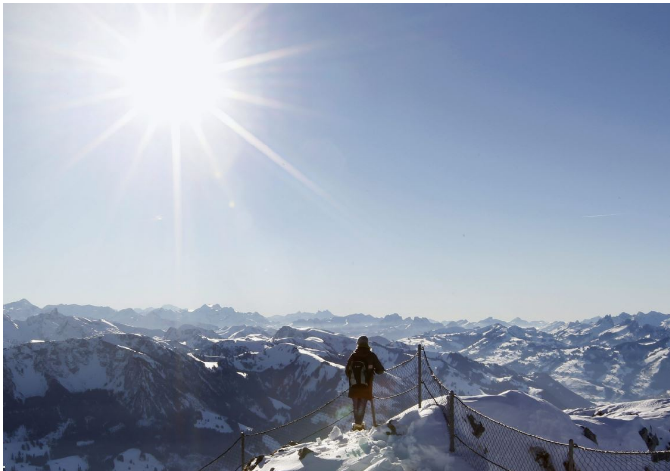
Стокхорн глазами Ули Маурэра

Еще одной горной вершиной мы можем любоваться благодаря министру юстиции и полиции Карин Келлер-Суттер: правда, она предпочла собственной «фотке» картину швейцарского художника Артура Висса, в 2018 году запечатлевшего Сентис, в Восточной Швейцарии. Можно ли рассматривать указание министром веб-сайта художника, как рекламу? Стоит об этом задуматься.