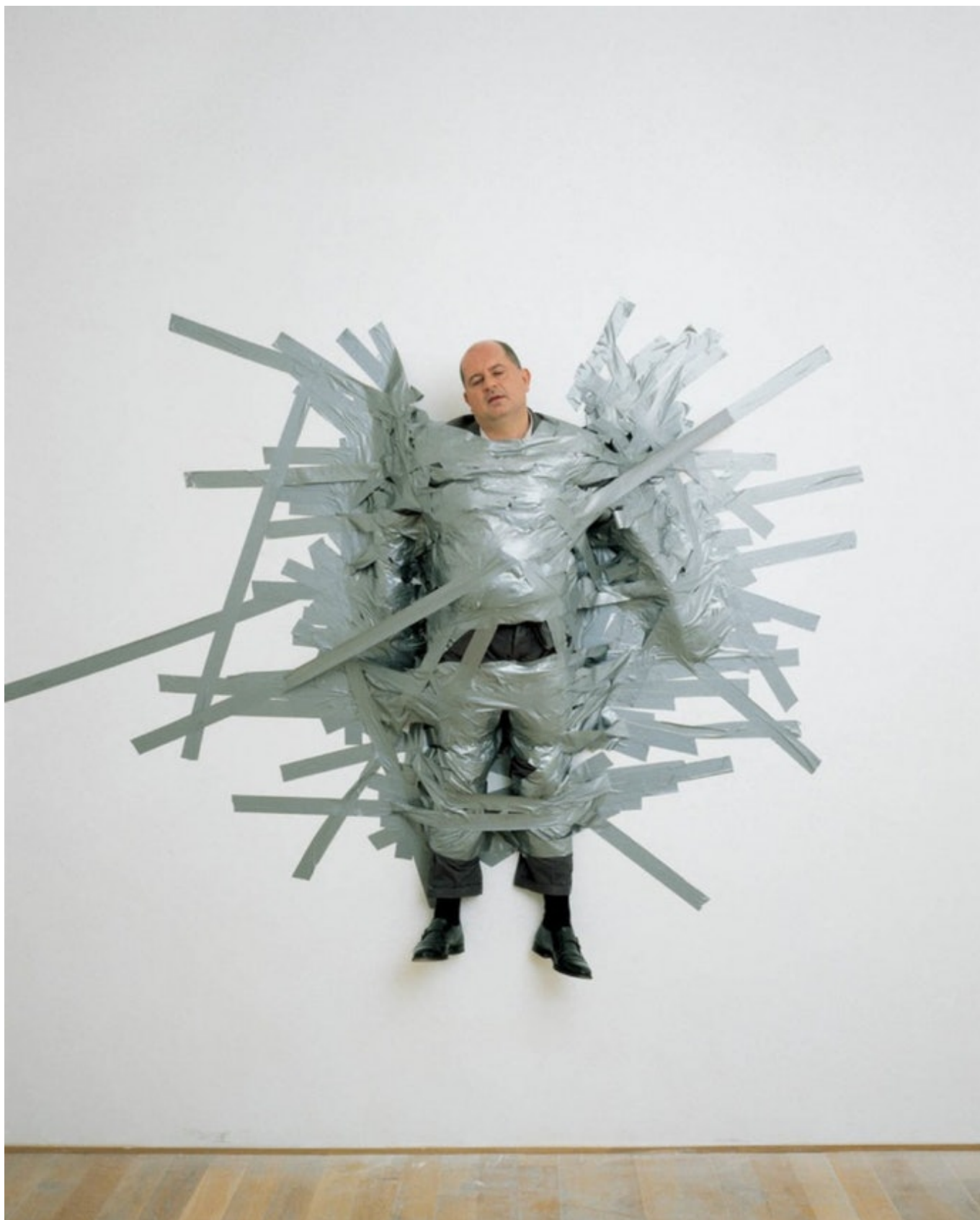
Маурицио Кателлан. Без названия, 1999 г.

Или вот еще «Золотой туалет» - такой «наш ответ Дюшану», хотя у того писсуар был перевернутым, чтобы не подумали, что можно им воспользоваться. Зато на Маурициевом творении, подключенном к канализации, каждый мог посидеть в свое удовольствие. Но кто-то из благодарных зрителей-пользователей не утерпел и спер, простите за просторечное выражение, такую полезную вещь!