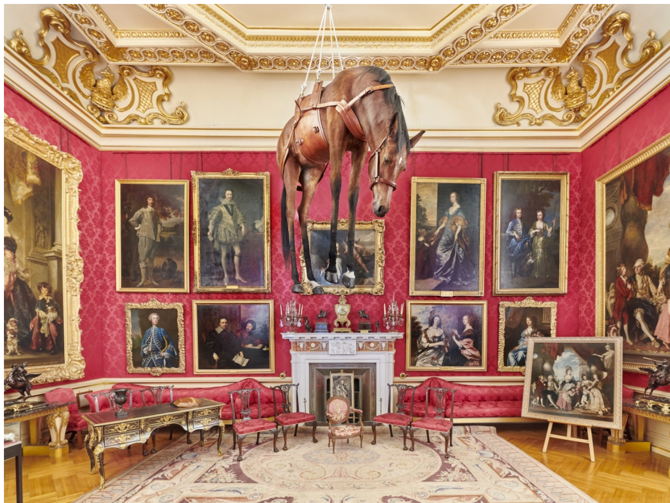
Маурицио Каттелан. «Баллада о Троцком» или Novecento, 1996 г.

На картинке мы видим лошадь, туалетную бумагу и грызуна. Что бы это значило? Подвешенную лошадь художник посвятил Льву Троцкому и размышлениям о судьбе русской революции. Лошадь, беспомощно болтающаяся посреди пустого пространства в полном снаряжении, буквально гипнотизирует. Как гипнотизировала человечество на протяжении всего 20 столетия «левая» утопическая идея, в итоге оказавшаяся такой же безжизненной, как набитое опилками чучело.