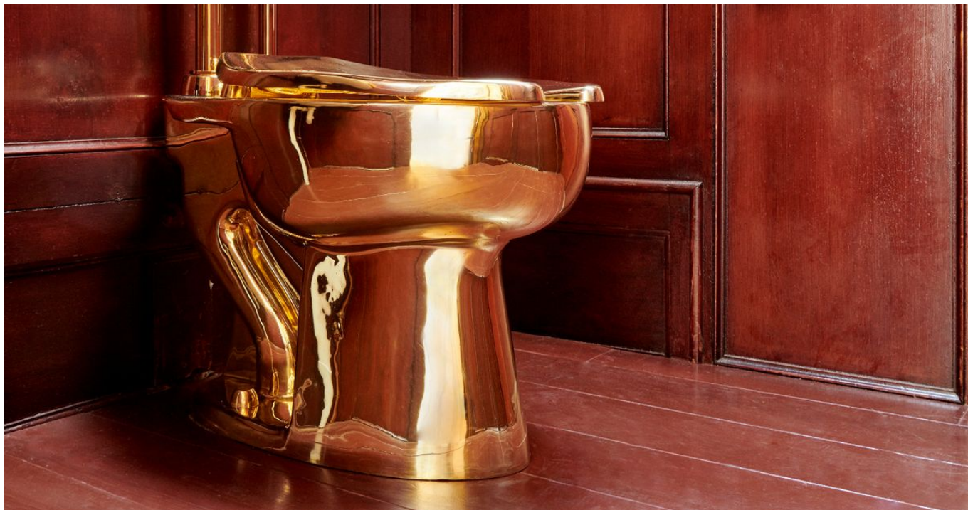
Маурицио Каттелан. «Золотой туалет», 1916 г., 18-каратное золото, был украден из Blenheim Palace

Известно, что, когда президент Дональд Трамп попросил руководство Музея Гуггенхайма в Нью-Йорке одолжить картину Винсента ван Гога «Пейзаж со снегом» (1888 г.) для временного экспонирования в Белом Доме, то получил в ответ: «А шнурки вам не погладить? Вот – возьмите лучше золотой унитаз, «Америка» называется, автор – Каттелан. Не прогадаете!» Насколько нам известно, ни президент Трамп не ответил, ни его администрация никак не прокомментировала письмо из музея. Но унитаз не взяли. Видно, обиделись.