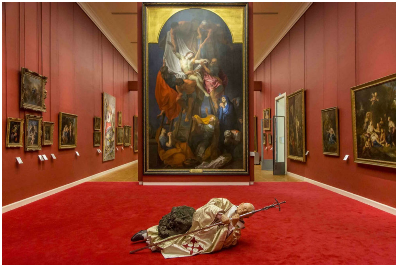
Маурицио Каттелан, «Девятый час» или «Папа, пораженный метеоритом», 1999 г.

Маурицио тоже мастер поразвлечься: украл, хихикая, чужую экспозицию и приволок ее в свой павильон, проводил интервью с мертвыми художниками, поджигал детские коляски, вешал восковые тельца мышей в миланском парке и ставил Гитлера на колени в угол... Этот перечень можно долго продолжать. Его часто обвиняют в пристрастии к провокациям, к пошлым решениям, в китче и дурном вкусе. А он знай себе отвечает: «Для меня хороший вкус – как и вообще вкус – это забота мороженщика». Итальянец, вырос на gelato, ясное дело.