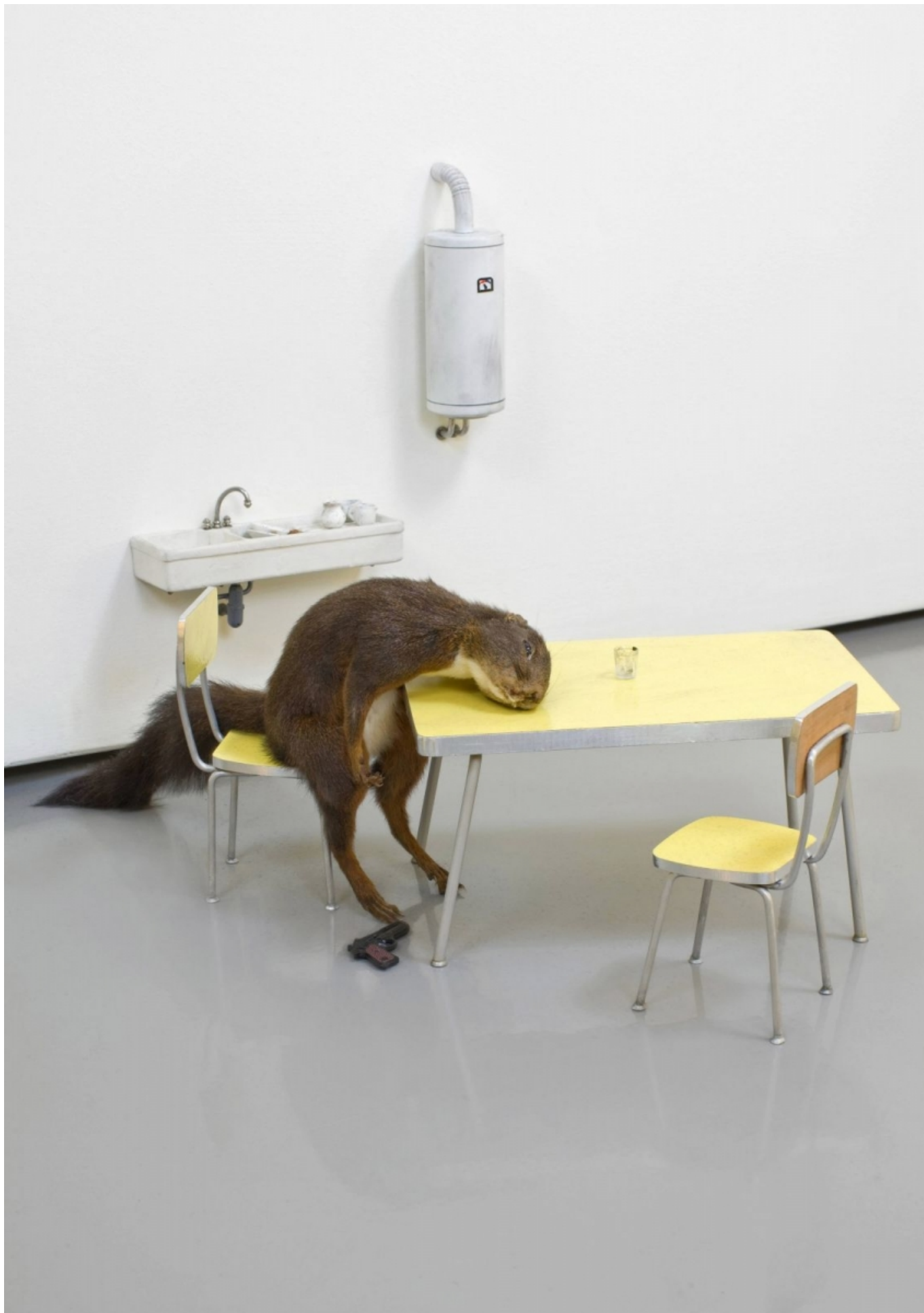
Маурицио Каттелан, «Bidibidobidiboo», 1996 г.