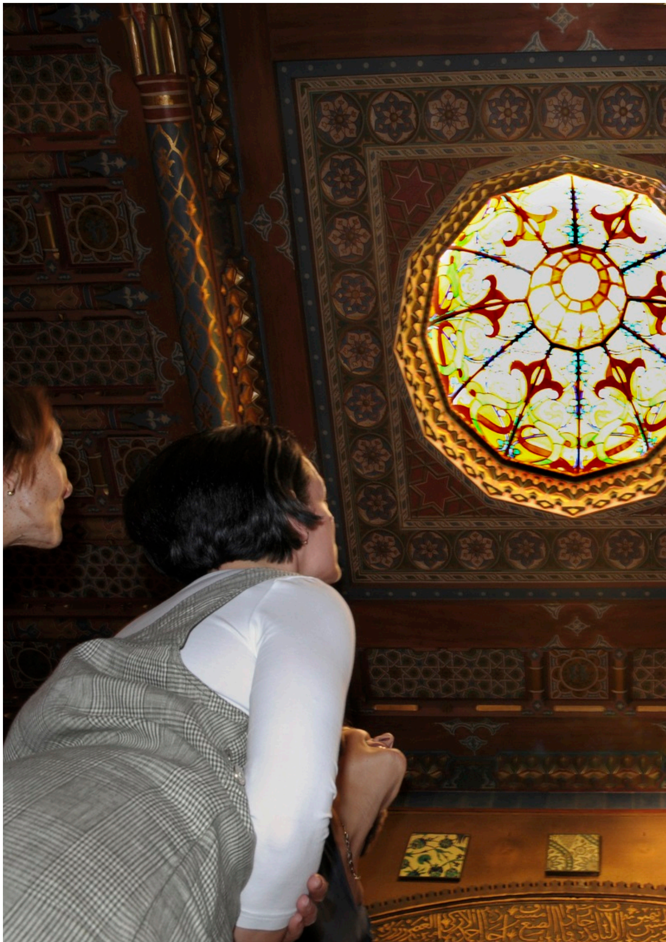
Персидская гостиная в Бернском историческом музее