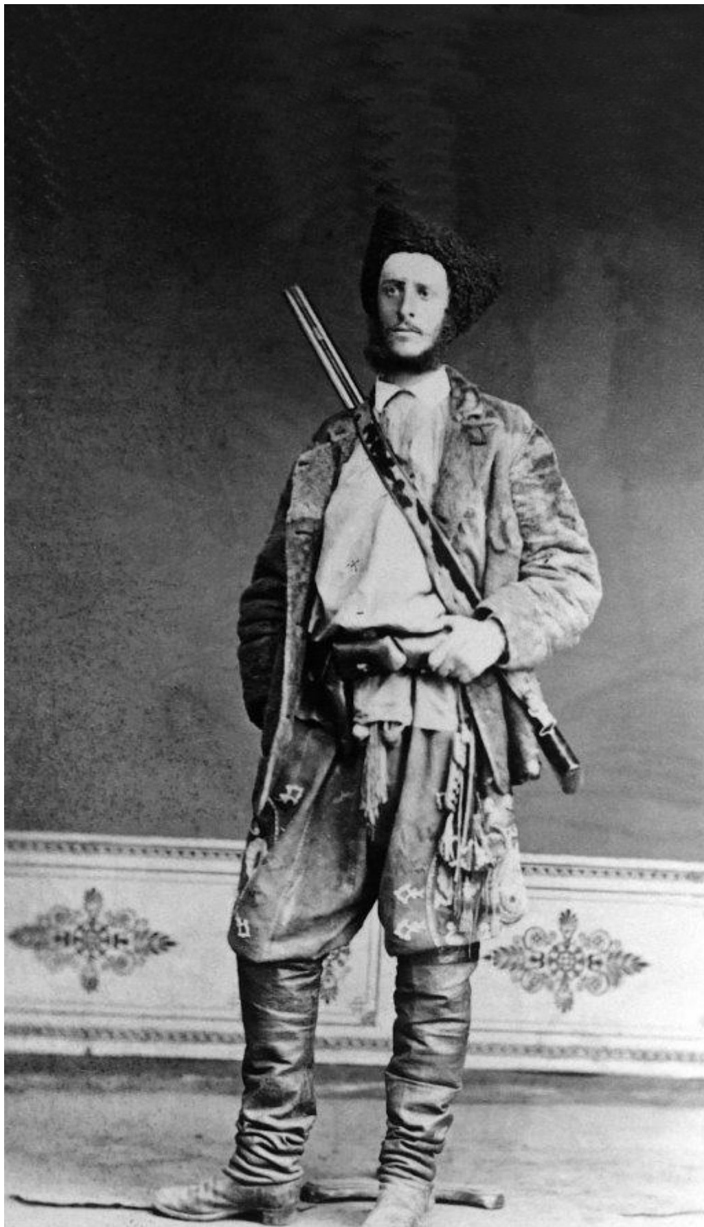
Анри Мозер в восточном наряде. Фотография из немецкого издания «Через Центральную Азию», 1888 г.

В 1869 году Анри совершил первое путешествие по российскому Туркестану – так в XIX веке назывались входившие в состав Российской империи земли Центральной