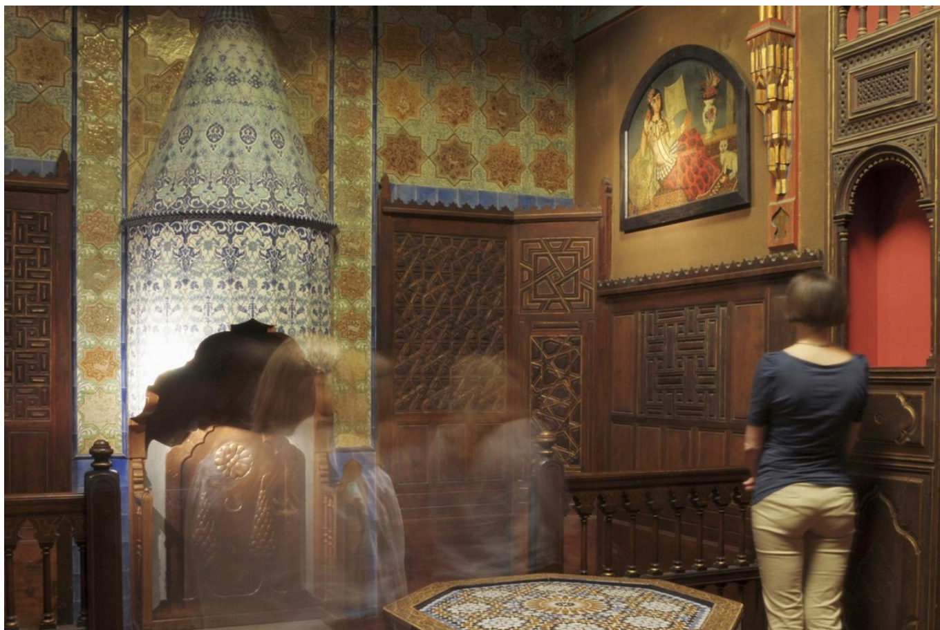
Персидская гостиная в Бернском историческом музее