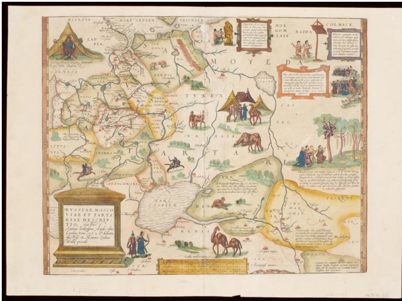
Rvssiae, Moscoviae et Tartariae descriptio Карта Руси, Московии и Тартарии, опубликована в Лондоне в 1562 году. Автор Энтони Дженкинсон. (Jenkinson, Anthony: Rvssiae, Moscoviae et Tartariae descriptio. Edita Londini anno 1562)

Мы продолжаем повествование, начатое неделю назад . Сегодня вы узнаете о коллекции "Rossica Europeana", собранной русофилом-автисоветчиком и хранящейся в Берне.