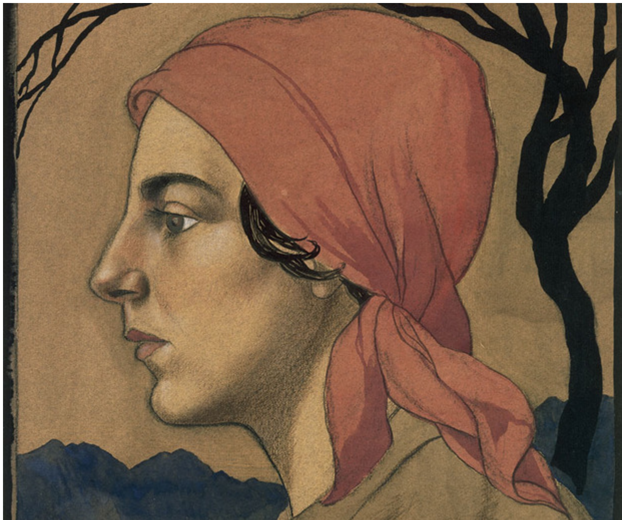
«Девушка в красном платке» Шарля-Кло Олсомме из коллекции кантонального банка Вале, Art.bcvs.ch

Картины покупаются не для того, чтобы просто украшать стены кабинетов и быть спрятанными от глаз широкой публики. Напротив, коллекции время от времени демонстрируются всем желающим. Страховая компания La Mobilière, которая начала собирать искусство в конце 30-х годов прошлого века, дважды в год проводит тематические выставки в головном офисе в Берне. Упор делается на современном искусстве как отражении социальных процессов.