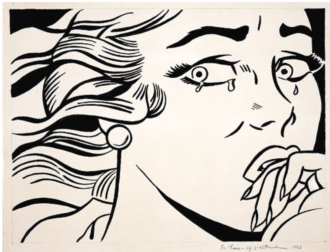
«Плачущая девушка» Роя Лихтенштейна из коллекции UBS, Ubs.com

фармаконцерн Roche подарил Базелю музей Tinguely, посвященный творчеству швейцарского скульптора Жана Тэнгли .