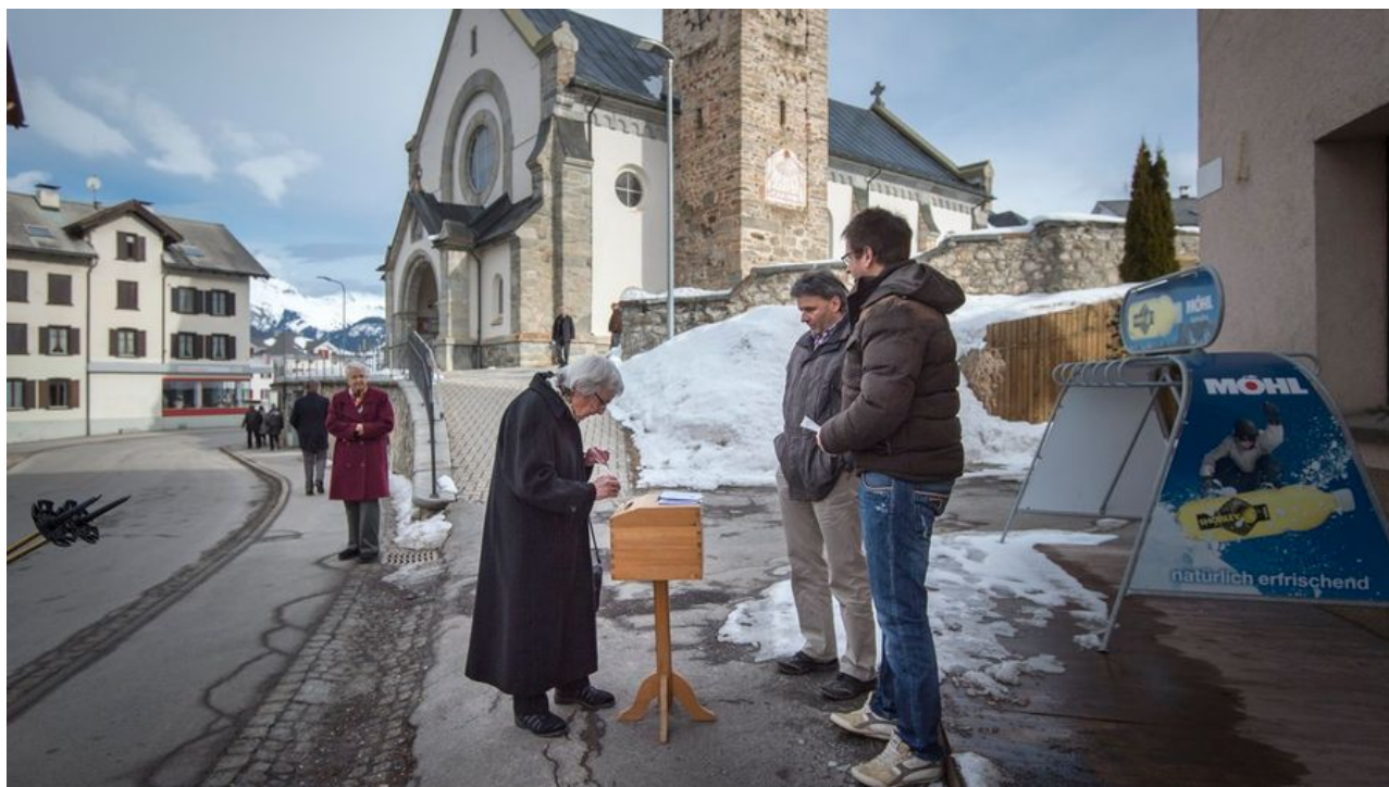
12 февраля в Граубюндене - важный день

Добавим, что помимо федеральных проектов в прошлое воскресенье кантоны голосовали и по вопросам местного значения. Так, жители Невшателя высказались в поддержку двух автономных госпиталей, не одобрив предложенный властями проект реорганизации (подробнее об этом Наша Газета.ch уже рассказывала ). В кантоне Во был принят новый закон, направленный на борьбу с нехваткой жилья, а жители Граубюндена (где сейчас проходит чемпионат мира по гонолыжному спорту ) в очередной раз «похоронили» идею проведения в кантоне зимних Олимпийских Игр 2026 года, подтвердив позицию, занятую в 2013 году, когда шла речь об Играх 2022 года. Таким образом, « Сион-2026 » остается единственным проектом, претендующим на звание региона, готового принять у себя сильнейших спортсменов мира в 2026 году. Окончательный ответ на вопрос о том, станет ли Швейцария выдвигать свою кандидатуру, – за Швейцарским олимпийским комитетом.