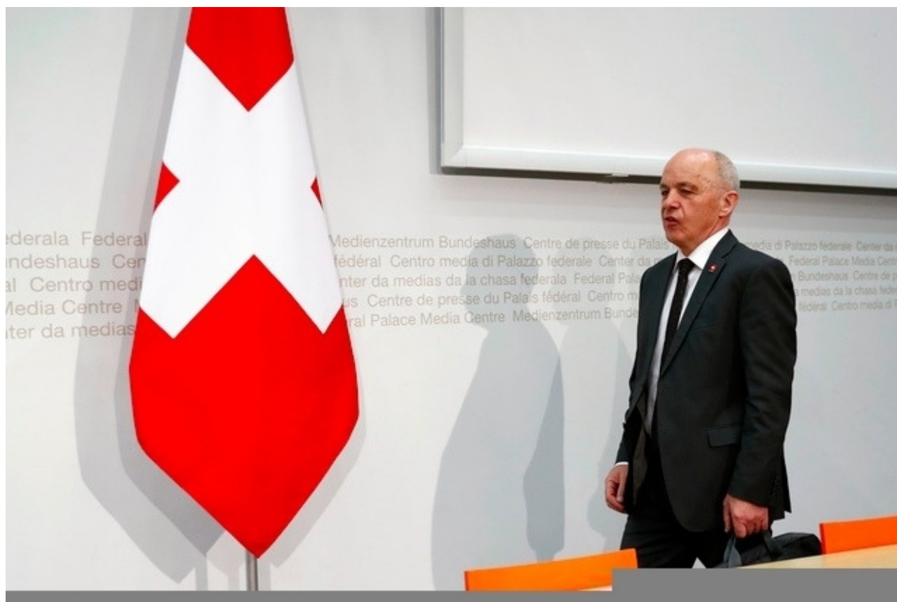
Отказ от RIE III в прессе называют "пощечиной Мауреру"

и народом, а Luzernerzeitung проводит параллель с Brexit и выборами Дональда Трампа, которые также стали свидетельством низкого уровня доверия к действующей власти. Таким образом, в данном случае речь идет не просто о будущем налоговой реформы (которая, как считают противники RIE III, все же должна быть проведена), но о вопросе фундаментального отношения населения к представителям экономических кругов, отмечает Argauerzeitung. Такого же мнения придерживается и NZZ, а Blick называет результат голосования не просто победой левых, а настоящим мятежом против буржуазных элит.