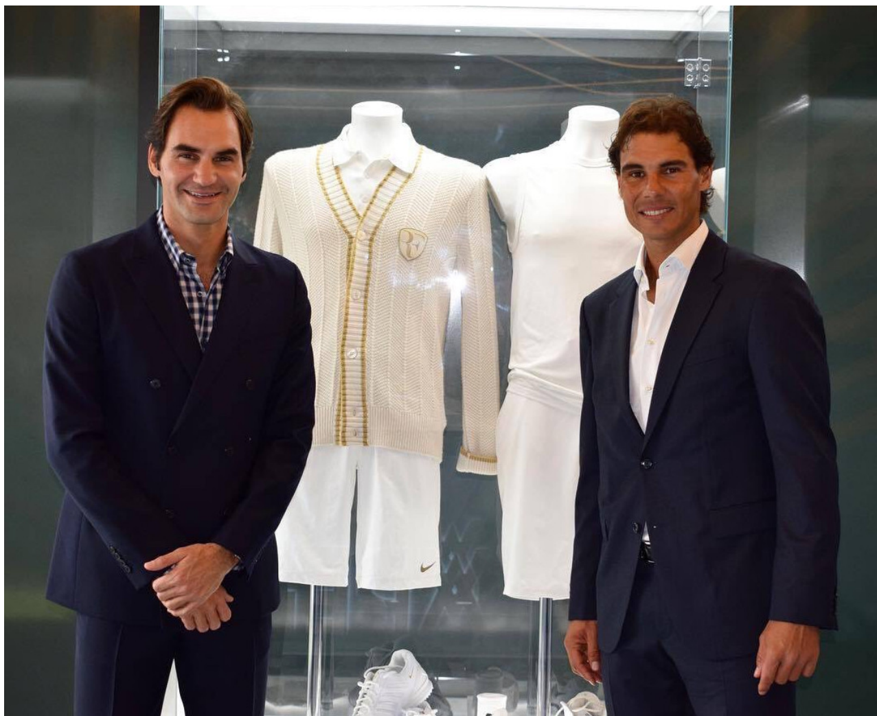
На открытии Теннисной академии Рафаэля Надаля

В октябре чета Федереров была замечена на Неделе моды в Париже, а затем спортсмен присутствовал на открытии Теннисной академии Рафаэля Надаля. «Если мои дети захотят сделать карьеру, я отправлю их сюда», – заявил швейцарец. В ноябре он приступил к тренировкам в Дубаи. Наконец, в декабре вышло его интервью в New York Times , в котором он признался: «Не хочу сказать, что 2016 год для меня не существовал. Просто потому, что он стал одним из самых незабываемых в моей жизни. Я чувствую, что буду вспоминать все те дни, когда преодолевал трудности». Наполовину южноафриканец по матери, он хорошо усвоил урок своего великого соотечественника Нельсона Манделы: «Я никогда не проигрываю. Я либо выигрываю, либо учусь».