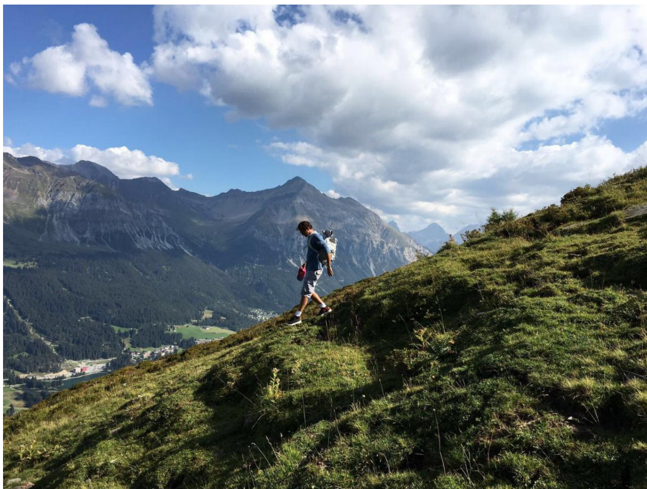
Отдых в Альпах

Увы, триумфальному возвращению на газон Уимблдона тоже не суждено было состояться: упав, Федерер оставался лежащим на несколько секунд дольше обычного, собираясь с силами, чтобы закончить очередной трудный матч. Неподвижный белый силуэт на зеленой траве надолго запомнится поклонникам тенниса.