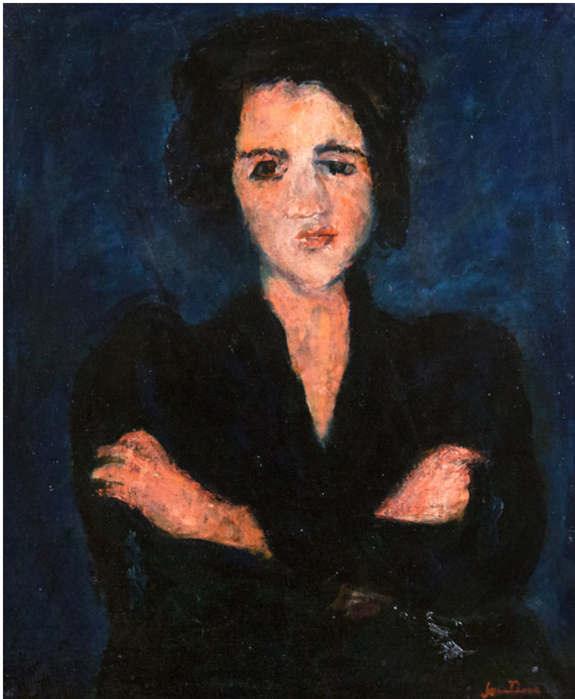
Хаим Сутин. Ева (1928)