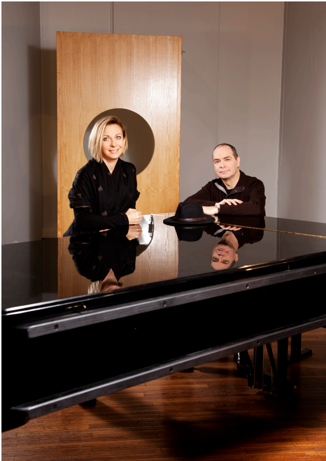
Натали Дессе и Филипп Кассар