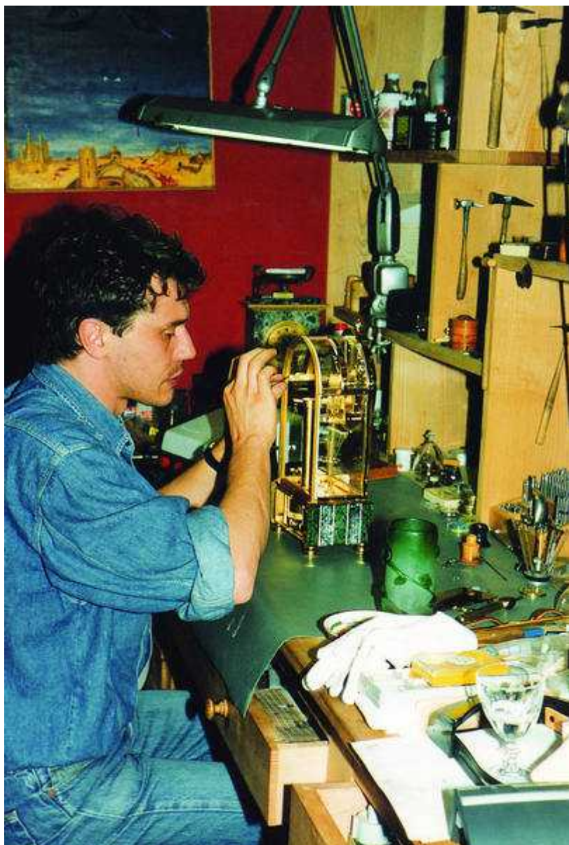
Ф.П. Журн в двадцатилетнем возрасте

Видя свою конечную цель в помощи молодым коллегам по созданию собственных брендов, руководство Академии прекрасно понимает важность их «вращения» в профессиональных кругах, контактов с прессой и возможности представить свои творения публике, коллекционерам и любителям. Вот почему начиная с 1987 года АНСИ активно участвует в самых различных выставках и ярмарках, не забывая главную – Базельскую. Инициативы учащихся Академии находят понимание и поддержку у старших товарищей, уже получивших заслуженное признание.