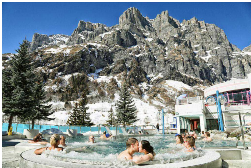
Купание в термальной воде в Лойкербаде (leukerbad-therme.ch)

В Моршах (кантон Швиц) по адресу Dorfstrasse 10 расположен отель Swiss Holiday Park , в котором, кроме гидромассажа, детских бассейнов и стометровой водной горки, к услугам клиентов – романо-ирландские бани, джакузи с соленой водой, сауна, укрепляющие ванны, массаж, фитнес-центр и салон красоты. Отель примечателен тем, что в нем предусмотрены многочисленные удобства для семей с детьми, включая игровые площадки, большую детскую зону и «скалы» в бассейне, минигольф, детскую школу картинга, празднование детских дней рождения, детские меню, и несколько детских площадок на свежем воздухе.