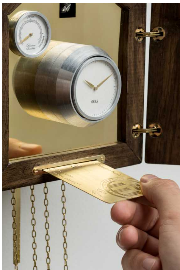
Мари Иволь "Швейцарский рай"

Для многочисленных иностранцев швейцарские Альпы и были такой «картинкой», моделью мирного фермерства, управляемого незыблемыми правилами, неподвластными влиянию извне. Именно поэтому часы с кукушкой как символ этого идеализированного представления о Швейцарии и как бы «остановившегося времени», и стали своеобразной эмблемой страны.