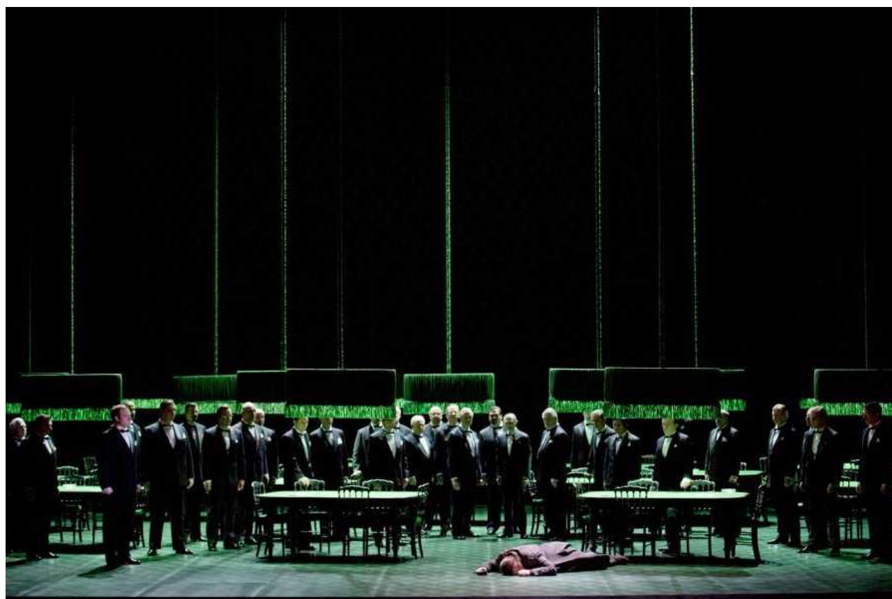
О жалкий его жребий...

От редакции: Спектакль будет идти на сцене Оперного театра Цюриха еще несколько раз в апреле, а затем в мае. Уточнить даты и заказать билеты легче всего на сайте театра .