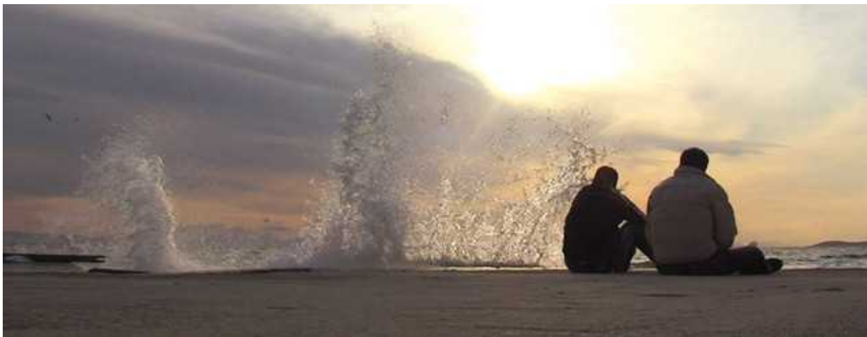
Кадр из фильма "Заход в порт"

Откроет программу картина швейцарского производства «Заход в порт» Каве Бахтияри . Этот документальный фильм рассказывает о судьбе беженцев из Ирана, после долгих скитаний оказавшихся в Афинах. Сложные и порой трагические истории объединяет общий лейтмотив – страх перед неизвестностью, незащищенность и перспектива стать вечным скитальцем. Затрагиваемые проблемы звучат особенно актуально в контексте дебатов о предстоящем в Швейцарии пересмотре закона о предоставлении убежища беженцам. Фильм идет на фарси и на французском.