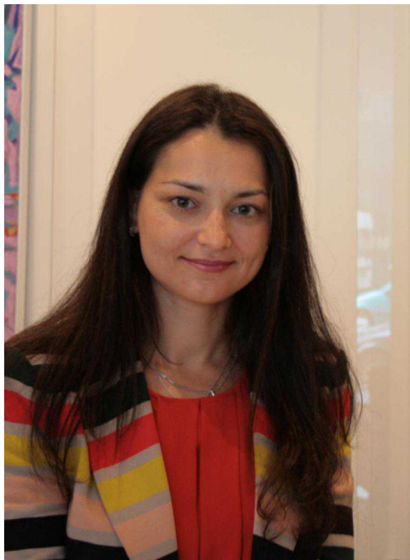
Александра Костенюк

n's Grand Prix примут участие 12 шахматисток, занимающих самые высокие позиции в рейтинге ФИДЕ. Все они хорошо знакомы любителям и поклонникам игры. Кратко представим только нескольких участниц, у каждой из которых свой стиль ведения шахматного поединка.