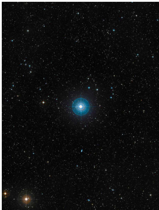
Вокруг Beta Pictoris, снимок VLT

Новый инструмент, в разработку которого значительный вклад внесли цюрихские ученые, снабжен коронографами, прикрывающими часть света, излучаемого звездой, так что можно рассмотреть ее корону и небесные тела, находящиеся в непосредственной близости от нее. Обычно в коронографах используется два оптических элемента, настроенные друг на друга таким образом, чтобы приглушать яркий свет звезды. Новое оптическое устройство, названное Apodizing Phase Plate (APP), использует только один коронограф, уменьшающий свечение звезды в объективе. Свет преломляется в нем по такому же принципу, как в воде океана, поэтому и небесные тела отображаются иначе, - объясняет профессор Института Астрономии ETH Саша Кванц, руководитель проекта.