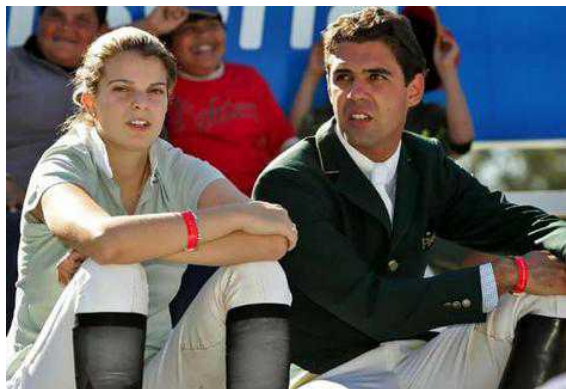
Афина Онассис с мужем

В Швейцарии поселилась внучка Аристотеля Онассиса Афина Онассис. Она знаменита также тем, что вышла замуж за бразильского жокея - олимпийского чемпиона по верховой езде Алваро Алфонсо де Миранда. Состояние ее равняется 3 млрд. франков.