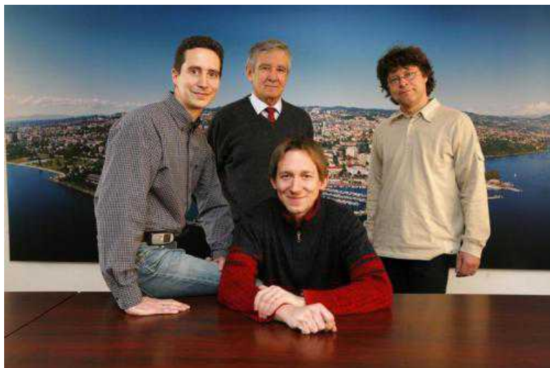
Motilis - профессор Кучера и его команда

Каждая такая видеокапсула представляет собой сложную электромагнитную структуру: она снабжена источником света, батарейками, рассчитанными на 8 ч, объективом с полем зрения 140°, снимающим по 2 кадра в секунду, электромагнитом, передающим радиочастоты, и микросхемой, которая превращает реальное изображение в цифровое. Обследуя Вашу пищеварительную систему изнутри, капсула посылает магнитные волны, которые регистрируются антеннами и датчиками, установленными на теле пациента, а впоследствии передаются на компьютер врача.