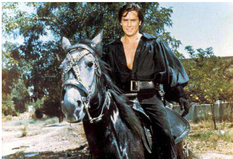
Кадр из фильма "Черный тюльпан"

Ален Делон заявил в интервью жене́вской газете Le Matin, что, хотя совершенно не интересуется политикой, впервые будет голосовать. К чему и призывает всех своих поклонников, любителей животных и просто сознательных людей. Легенда мирового кинематографа намерен дать свое «лицо» Водуазскому обществу защиты животных. Рекламная кампания начнется на будущей неделе.