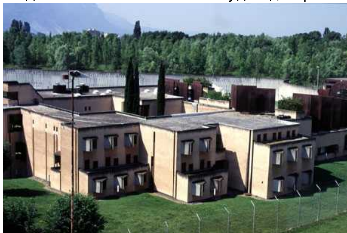
Здание тюрьмы Шан-Доллон в Женеве