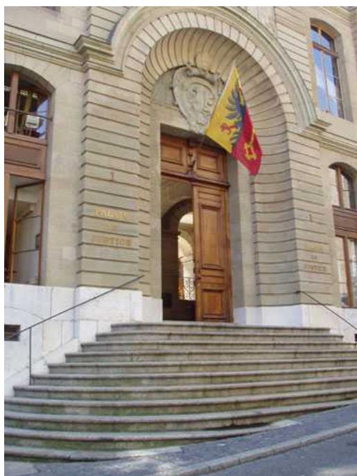
Дворец правосудия в Женеве [TdG]

Наша Газета.ch: Сергей, во всех этих случаях Вы выступаете адвокатом обвиняемых. Как Вы это переживаете с точки зрения морали?