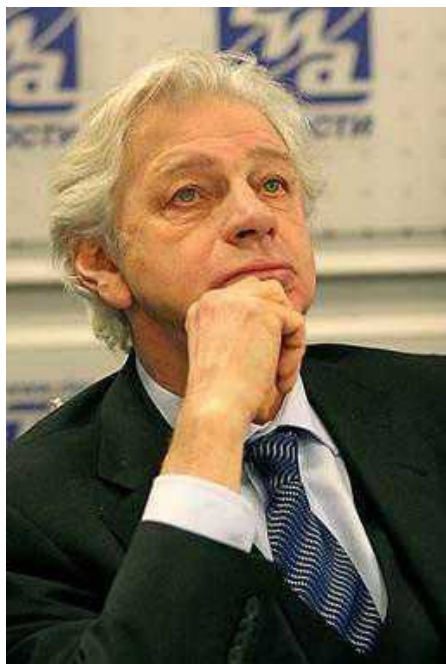
Знаменитый российский адвокат Генри Маркович Резник

Кто из швейцарских или российских адвокатов является для Вас примером, кумиром?