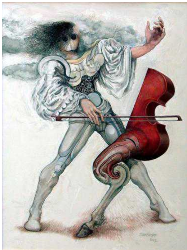
Serge Diakonoff. Concert baroque. Холст, смешанная техника, 2003, 119 x 89см. Частная коллекция, Швейцария.

С 1957 года и по настоящее время персональные выставки С.Дьяконова (более 25) проходили в Швейцарии, Франции, Германии, США. Несмотря на то, что в последние годы значительно возрос интерес российских музеев, галерей и коллекционеров к творчеству художников русского зарубежья, в России С. Дьяконова совсем не знают. Зато Франция, в отличие от России и Швейцарии, высоко оценила вклад апатрида Сержа Дьяконова в развитие пластических искусств, наградив художника Орденом искусств и литературы, являющегося одной из четырёх главных государственных наград Французской республики. Как говорится в Положении об ордене, он был учрежден (в 1957 г.) с целью отмечать наиболее выдающиеся явления мировой культуры.