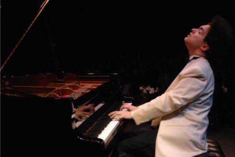
Играет Евгений Кисин

Поднимаясь на поезде из Мартины в Шабль, а затем на подъемнике в Вербье, забавно было смотреть, как поднимался по серпантину рекламный кортеж, разбрасывая фирменные кепки и прочую ерунду.