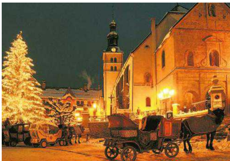
Центральная площадь вечером.

С 2004 года курорт Межев входит в престижную группу Best of Alpes.