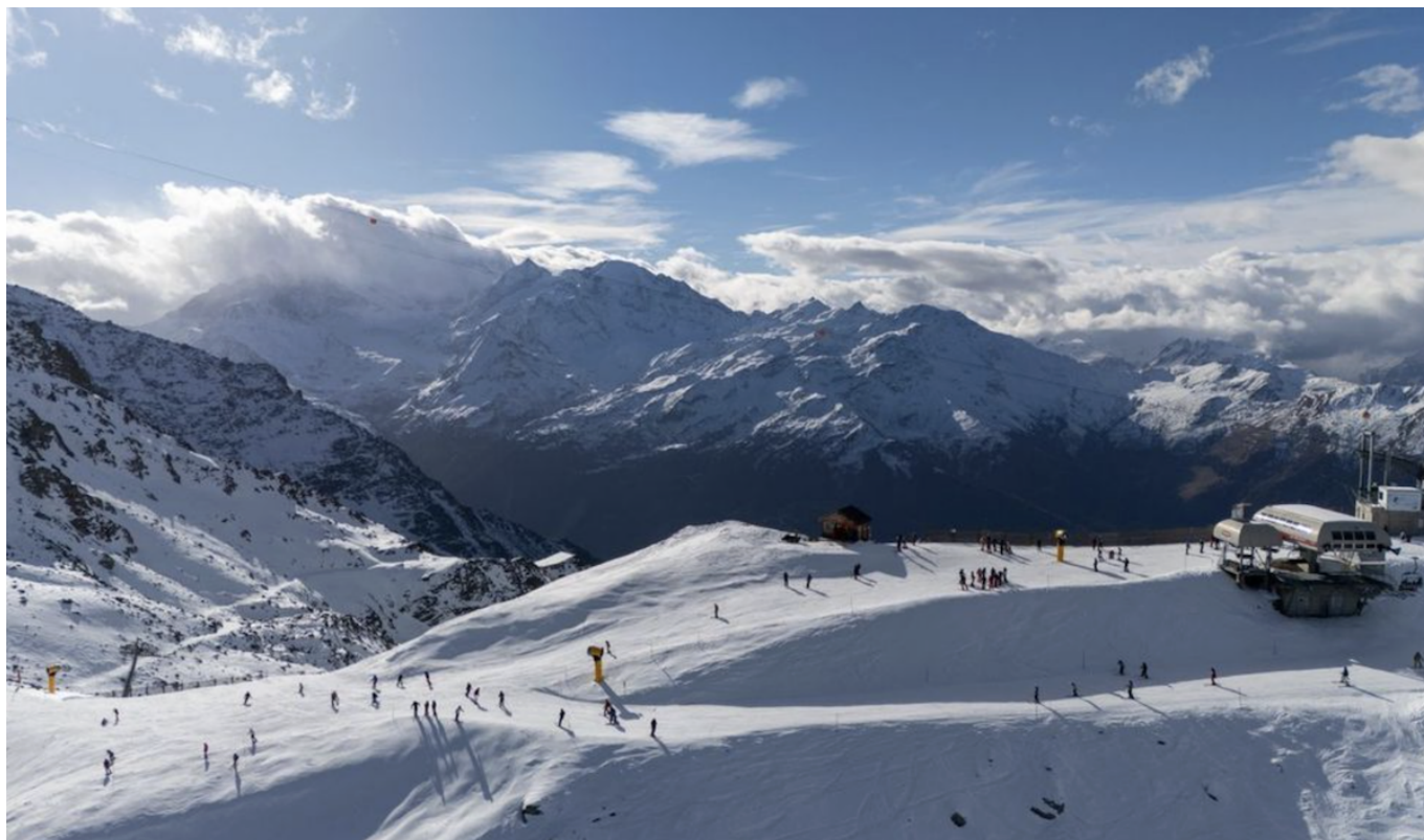
Зима в Вербье.

Author: Заррина Салимова, Берн , 21.11.2025.