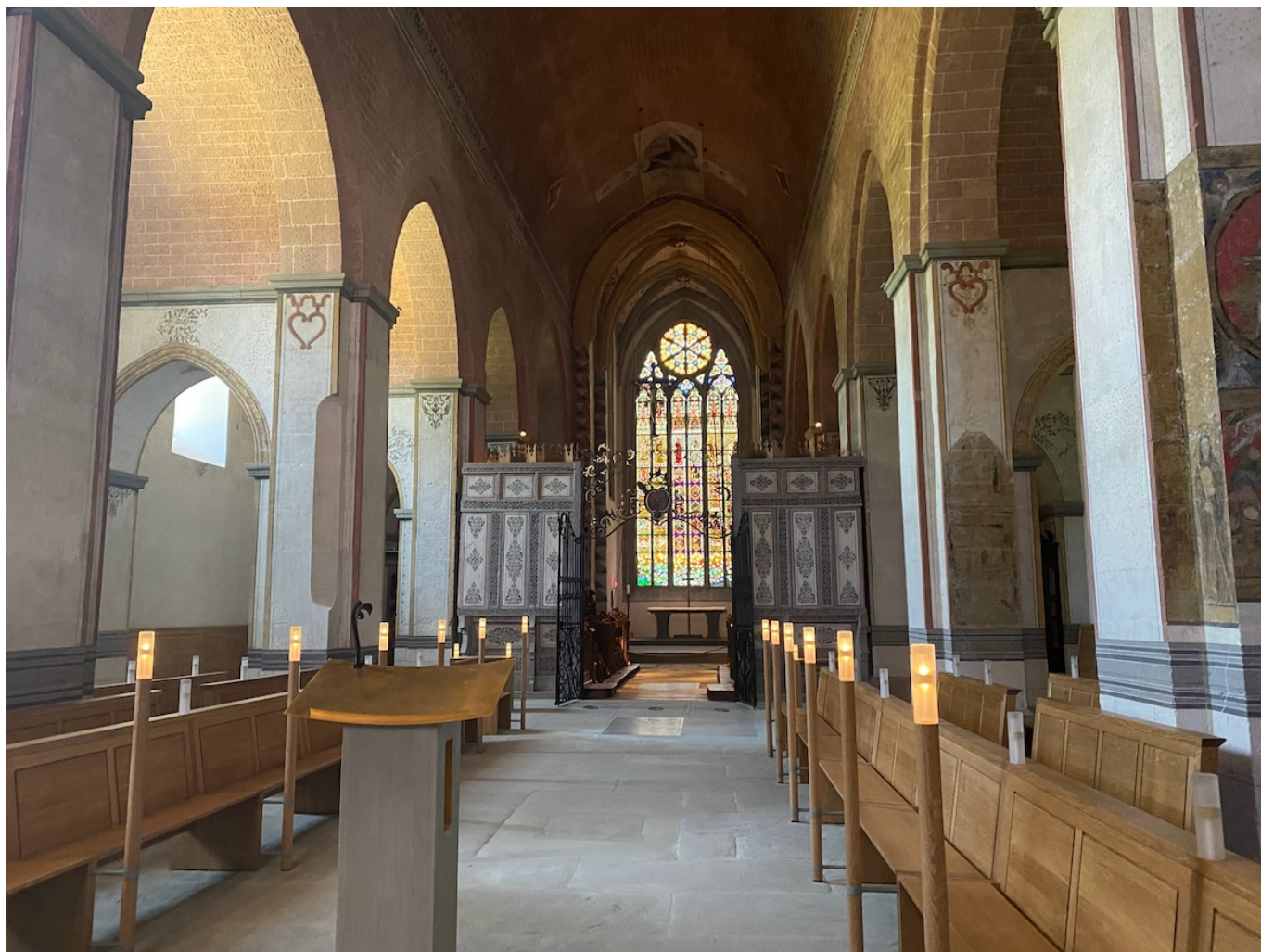
Церковь аббатства Отрив.