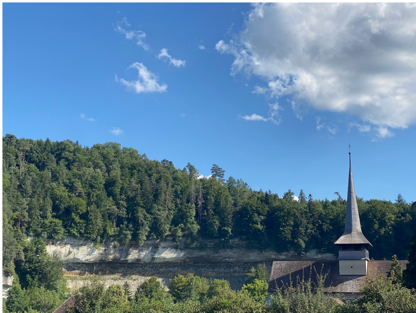
Аббатство получило свое название из-за расположения у скалы.

За почти девять веков своего существования аббатство, основанное в 1138 году Гийомом де Глан, пережило немало перипетий, грабежей, пожаров. После Зондербундской войны (1847) аббатство было упразднено находившимися у власти радикалами, которые экспроприировали монастырь и распустили общину. В зданиях разместилась сельскохозяйственная школа, а затем – педагогическая. В 1939 году цистерцианцы вернулись в Отрив. Несмотря на то, что в определенные периоды аббатство было частично секуляризировано, в XX веке оно вновь стало местом монашеской жизни.