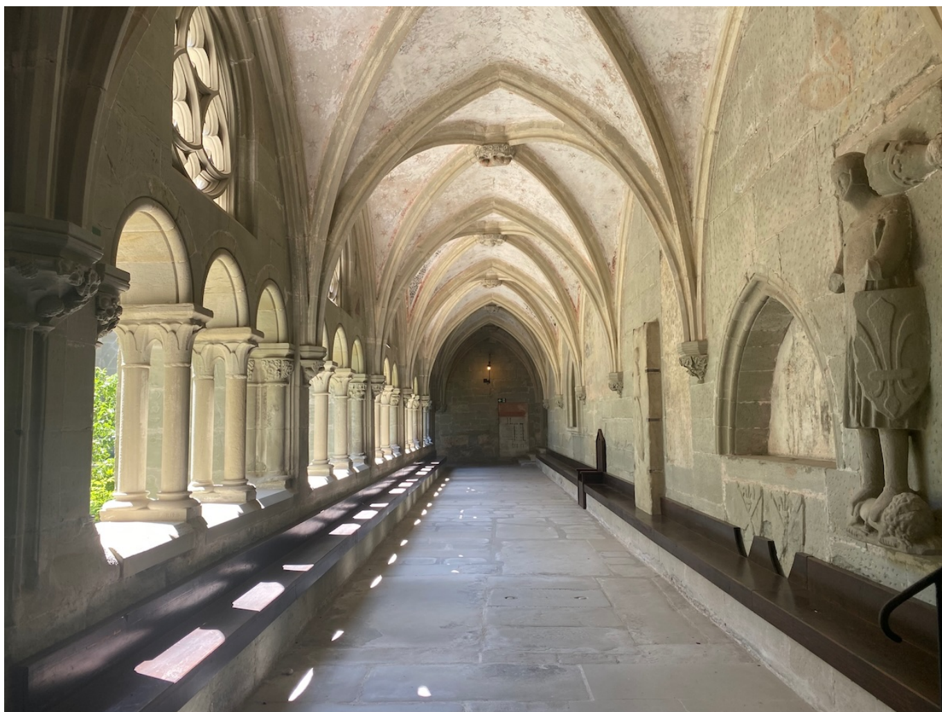
Клуатр аббатства Отрив.

Author: Заррина Салимова, Фрибург , 05.09.2025.