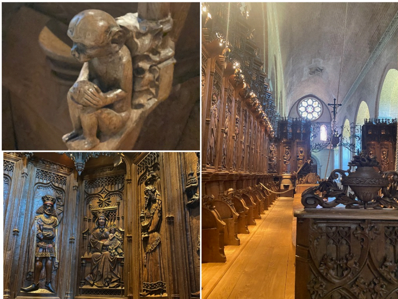
Скамьи церковного хора считаются шедевром XV века.

Самое же масштабное нововведение касается литургического пространства, которое было полностью переосмыслено. В частности, теперь барьер между монахами и прихожанами убран – верующие могут видеть монахов, проходящих от нефа к хору, решетка которого всегда открыта, и молиться вместе с ними. Некоторые даже называют это революцией.