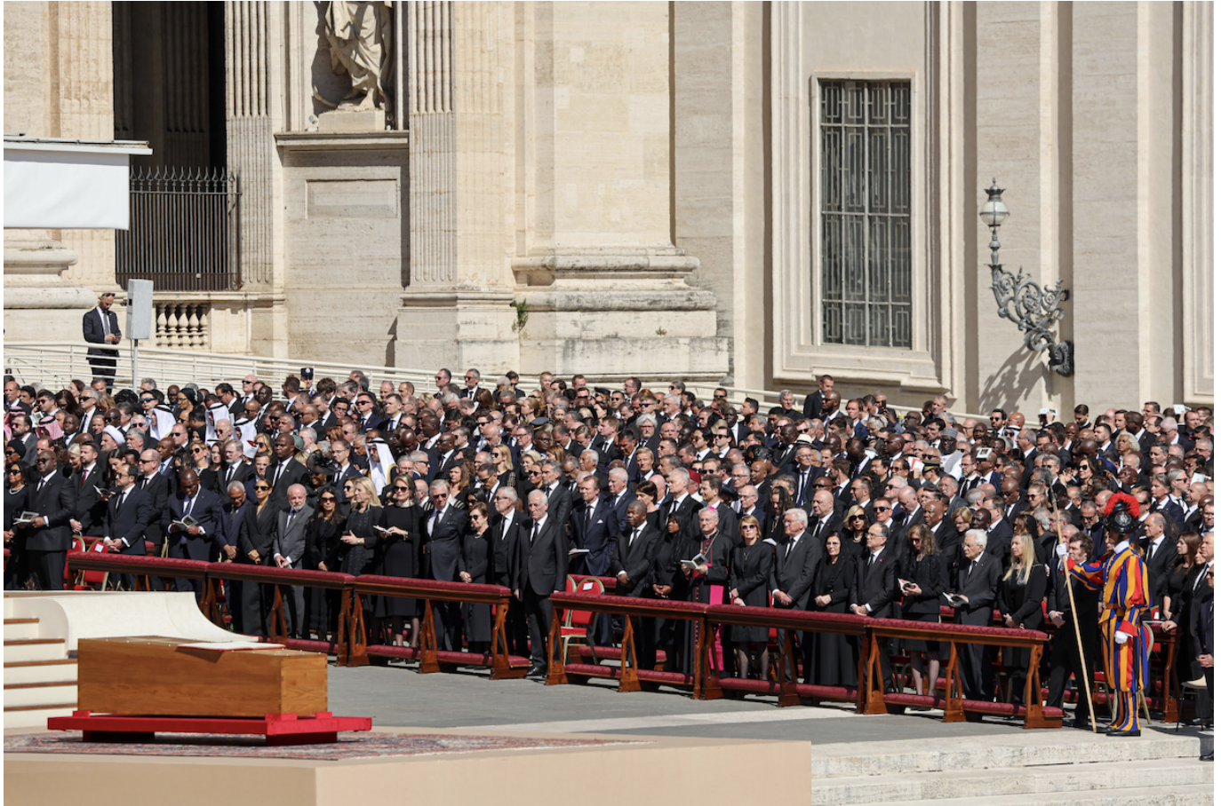
Швейцарский гвардеец у гроба папы римского.

В минувшую субботу в Ватикане прошла церемония прощания с папой римским Франциском, скончавшимся в пасхальный понедельник в возрасте 88 лет. Облетевшие все мировые СМИ фото и видео траурных торжеств вновь привлекли внимание к швейцарским гвардейцам, чья яркая униформа заметно выделялась на фоне черной одежды гостей.