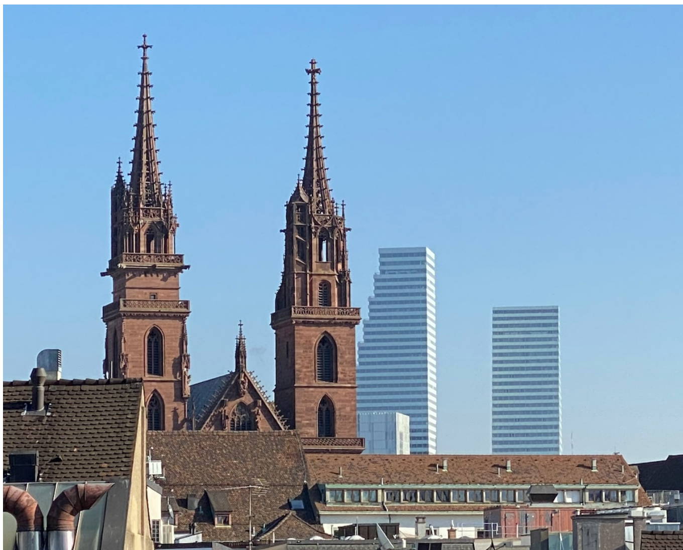
Базель – центр фармацевтической промышленности Швейцарии.

Author: Заррина Салимова, Базель , 29.04.2025.