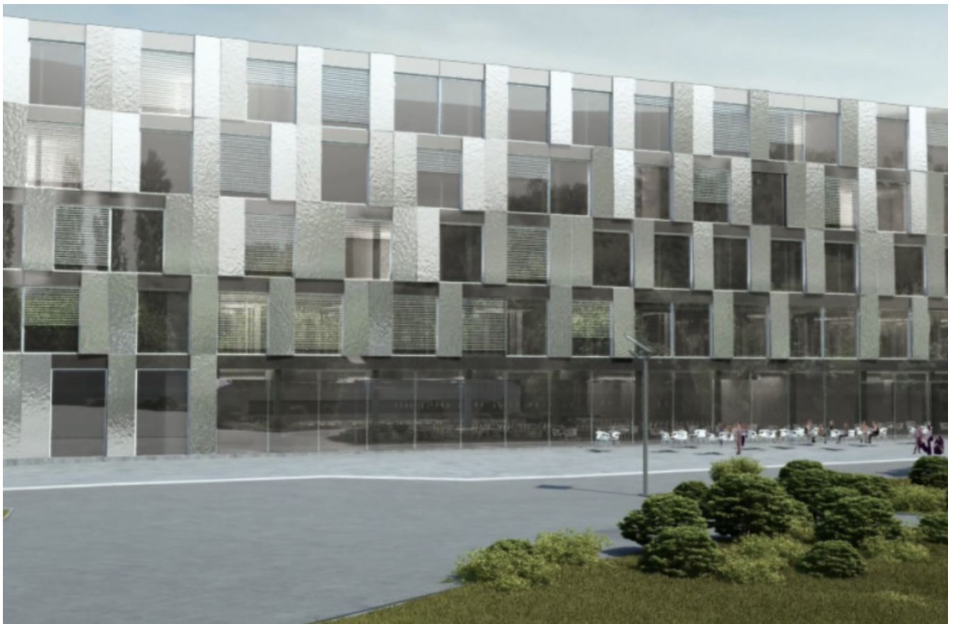
Корпус Géopolis.

Author: Заррина Салимова, Лозанна , 31.01.2025.