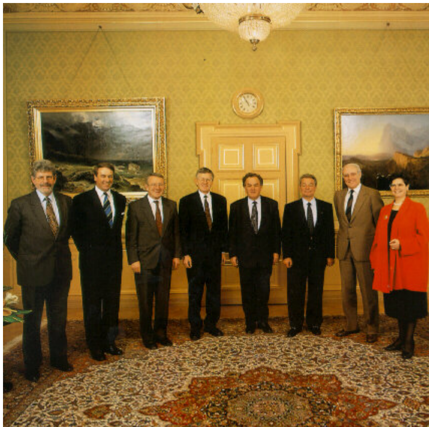
Федеральный совет в 1994 году. Слева направо: канцлер Франсуа Кушпен и федеральные советники Адольф Оги, Арнольд Коллер, Каспар Филлигер, Отто Штих, Жан-Паскаль Деламяра, Флавио Котти, Рут Дрейфус.

Сам же Федеральный совет в 1994 году столкнулся с кризисом доверия, так как оказался не всегда способным «вести народ за собой»: на избирательных участках провалилось предложение об участии Швейцарии в миротворческих операциях ООН, конституционная статья о содействии культуре и упрощенная натурализация для молодых людей иностранного происхождения. Однако правительство выиграло голосование о присоединении Швейцарии к Конвенции ООН против расизма.