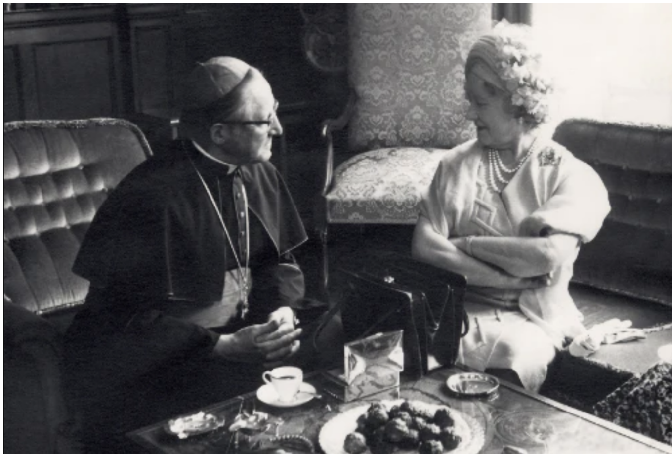
Королева-мать за чаем с шоколадными бомбочками © Confiserie Brändli

Добавим, что Швейцарское общество охраны наследия (Schweizer Heimatschutz) включило кондитерскую Brändli в число пятидесяти самых красивых кафе Швейцарии. Еще в начале прошлого века здесь назначали свидания, сюда приходили, чтобы пообщаться или узнать о мировых событиях по радио – редкой новинке для того времени. Интерьер «олдскульной» кондитерской на Банхофштрассе оформлен в британском стиле. Кофе сервируют на традиционном небольшом серебряном подносе, а к бомбочкам подают нож, без которого элегантно управиться с пралине диаметром четыре сантиметра было бы сложно.