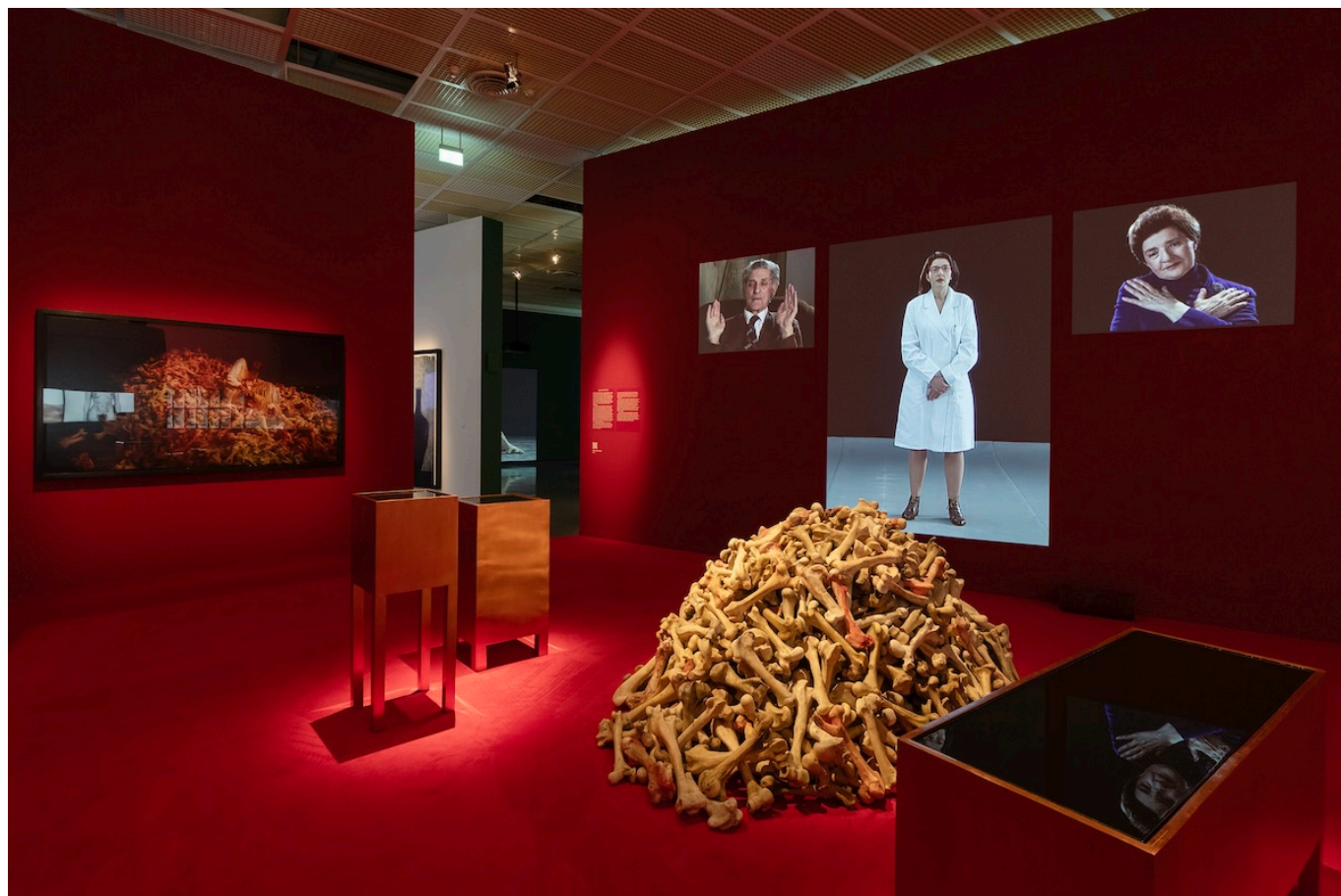
Kunsthaus Zürich, 2024

Вторая часть экспозиции более интерактивна: публика может стать частью перформансов, например, засесть за медитативную работу и отделить зерна риса от чечевицы, примерить каменные башмаки, прикоснуться лбом к минералу или пройти через портал из кристаллов. На открытии выставки Марина Абрамович не удержалась от ироничной критики в адрес швейцарцев, посоветовав им побольше смеяться над собой. Чтобы расшевелить и расслабить зажатых швейцарцев, художница, специально для ретроспективы в Кунстхаусе, сделала «декомпрессионную камеру»: посетителям предлагается запереть мобильные телефоны в шкафчике, надеть шумоподавляющие наушники и спокойно полежать шезлонге.