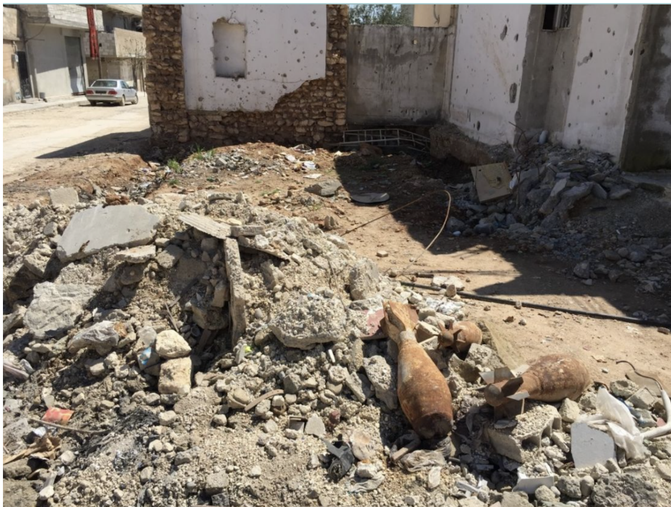
Кассетные бомбы

Author: Заррина Салимова, Женева , 16.07.2024.