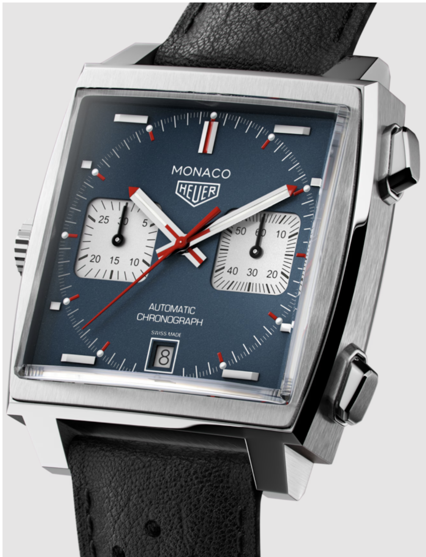
Tag Heuer Monaco

Сегодня квадратные часы переживают возрождение, что происходит не в последнюю очередь благодаря тому, что некоторые независимые дома решили создавать модели квадратной формы, например, Nomos, Bell & Ross, Narbel & Co или Blancarré. Квадратная серия есть и у демократичного бренда Swatch: линия биокерамических