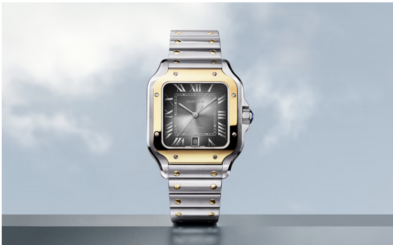
Современная модель Santos de Cartier

В 1940-50-х годах квадратные экземпляры были и в каталоге Rolex. Квадратные модели также выпускались такими домами, как Audemars Piguet и Vacheron Constantin, например, часы 50-х годов Vacheron Constantin «Cioccolatone» получили свое «шоколадное» прозвище, потому что они были похожи на кусочки популярного в Италии того времени шоколада.