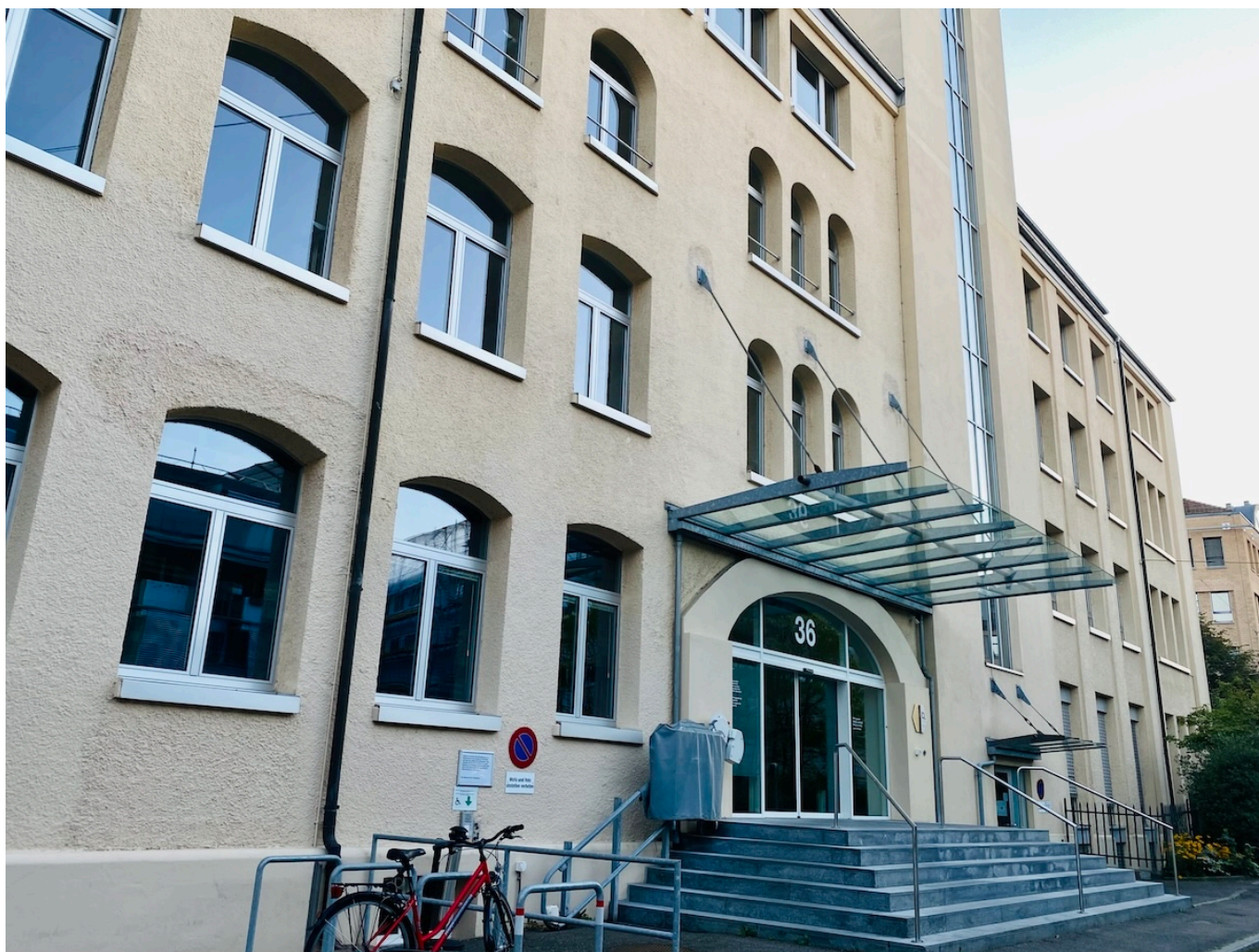
Офис SECO в Берне.

Author: Заррина Салимова, Берн , 25.04.2024.