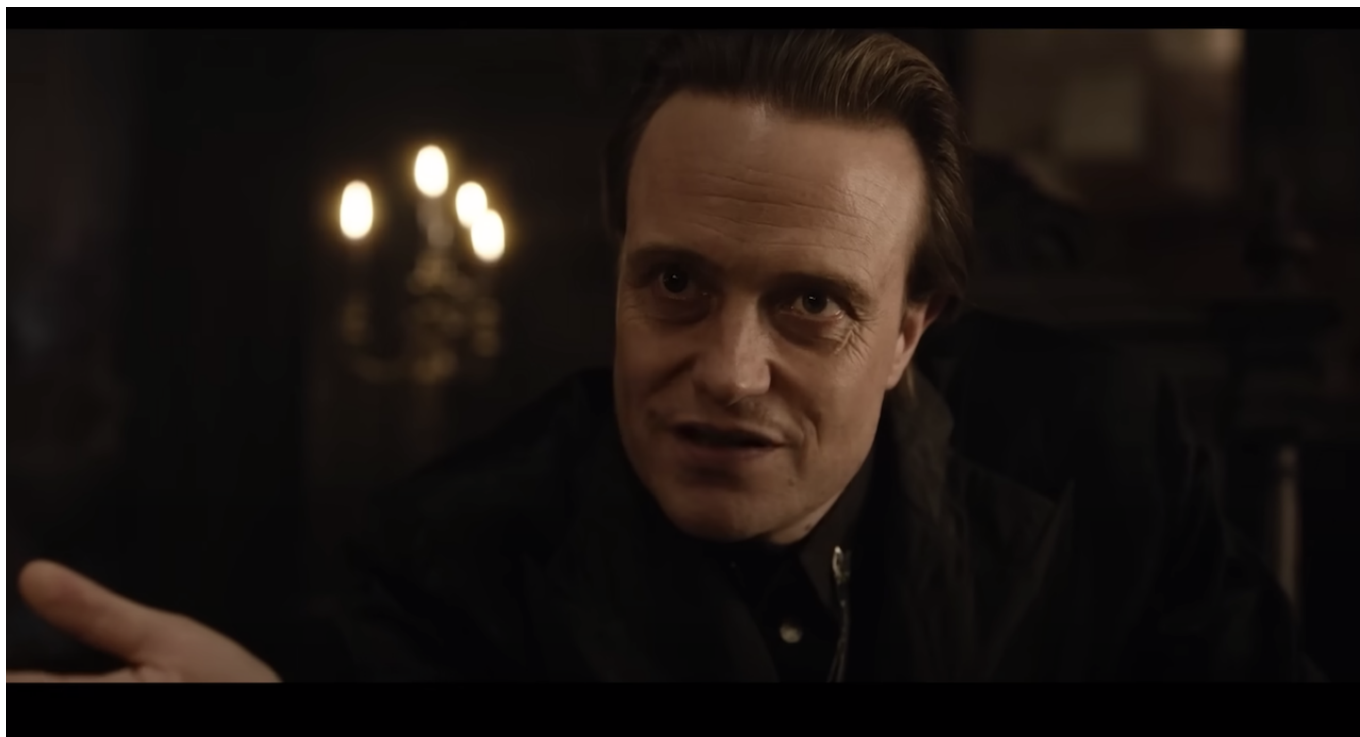
Воланл - актер Август Диль

Наши постоянные читатели знают, что именно в Базеле мы уже несколько раз сталкивались с довольно странными формами поддержки Украины - будь то в главном музее города или в университете . Можно лишь сожалеть о такой близорукости, как и о том, что мемориальная доска в честь Булгакова на здании областной больницы в Черновцах, где в 1916 году он трудился хирургом, в 2022-м была демонтирована. Зато Дом-музей в Киеве, где он родился, работает, как и Дом-музей в Москве, где он прожил почти всю жизнь, и эта тонкая булгаковская ниточка дает пусть маленькую, но надежду!